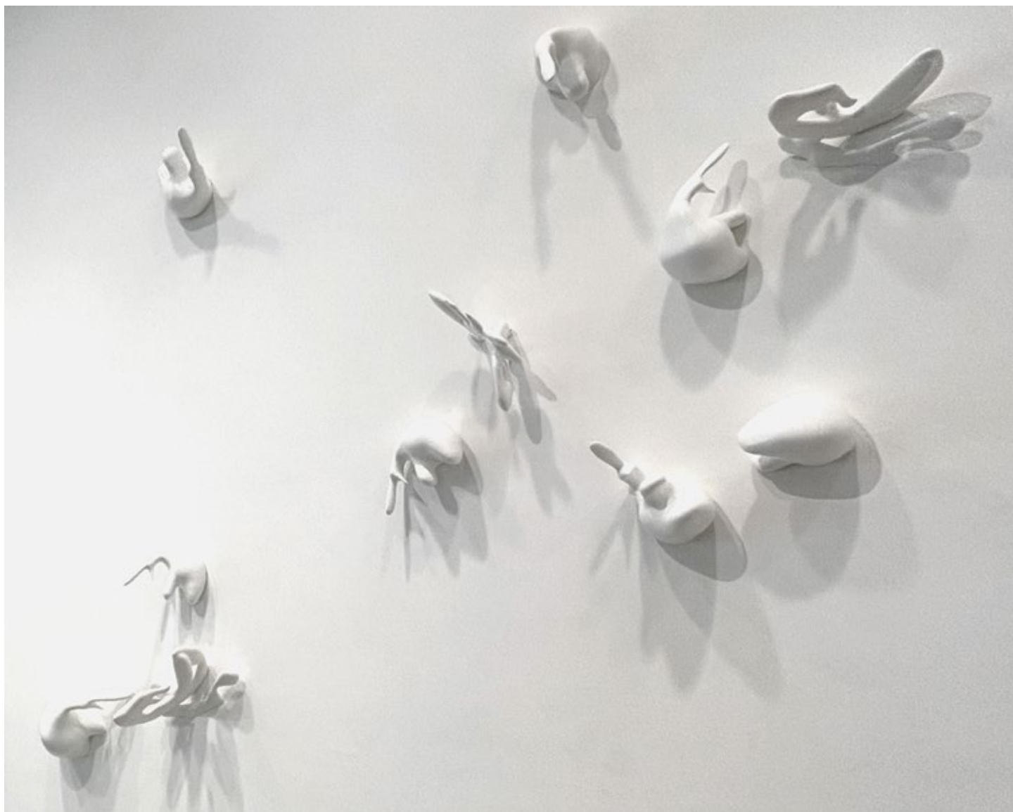
Објекти / Objects

2025, зидна инсталација / wall installation, димензија променљиве / variable dimensions