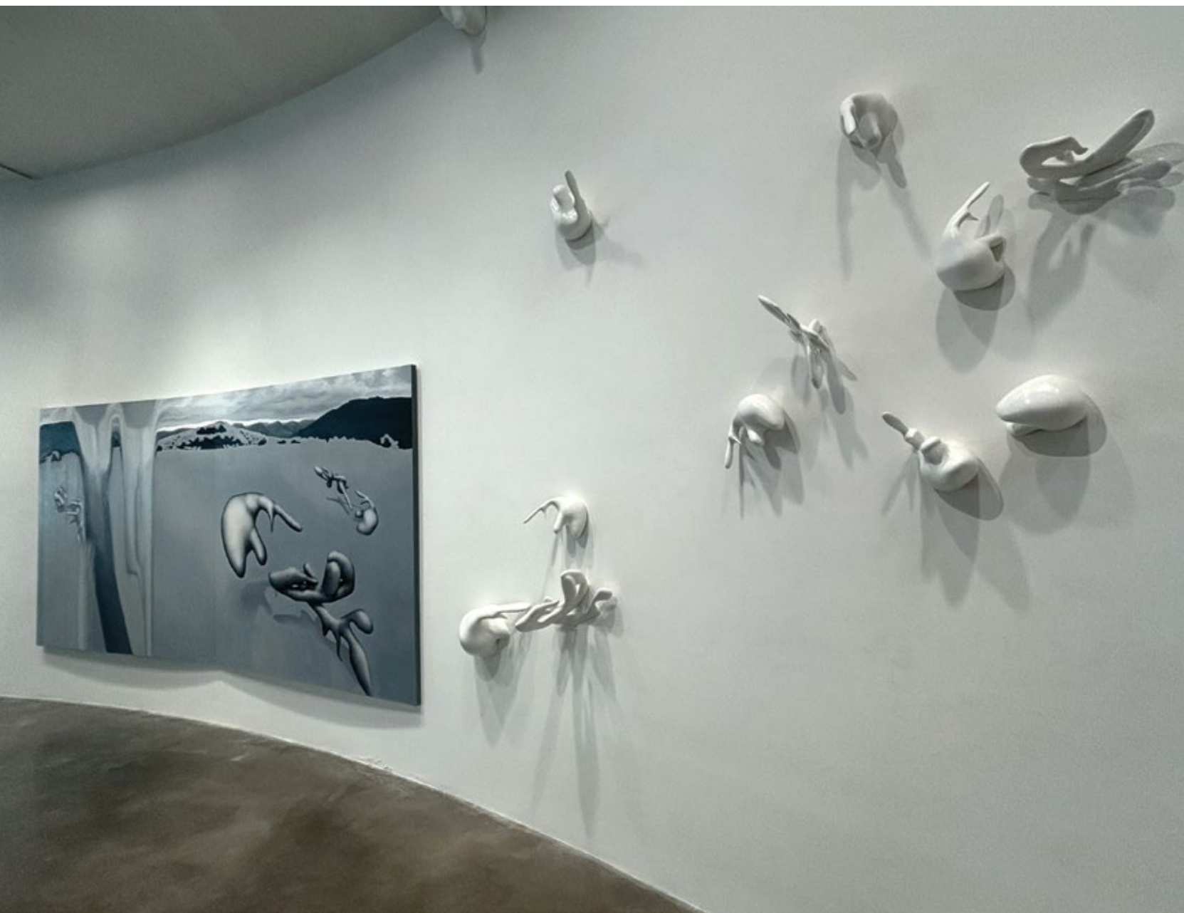
Игралиште 05 и Објекти / Playground 05 and Objects инсталација / installation, димензија променљиве / variable dimensions