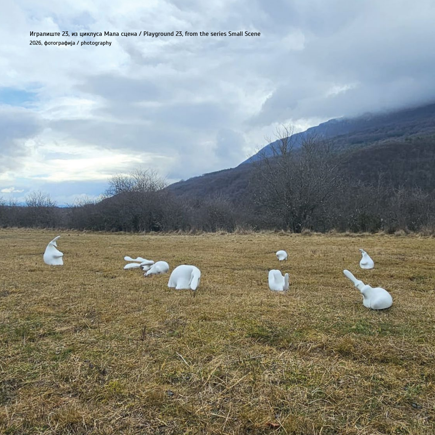
Игралиште 23, из циклуса Мала сцена / Playground 23, from the series Small Scene 2026, фотографија / photography