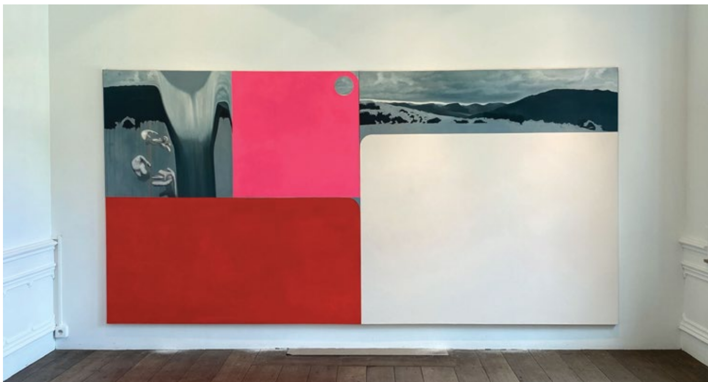
Игралиште 06 / Playground 06

2025, ПЛА и дрво, зидна инсталација / PLA and wood, wall installation