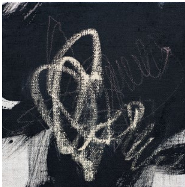
Унутрашње поље бр. 4 / Inner Field No. 4