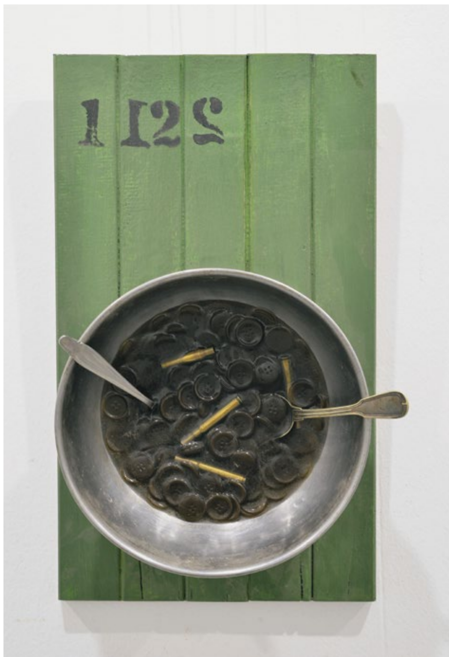
Оброк за министра војног / Meal for the Minister of War 2022, комбинована техника / mixed media, 27x54x15 cm