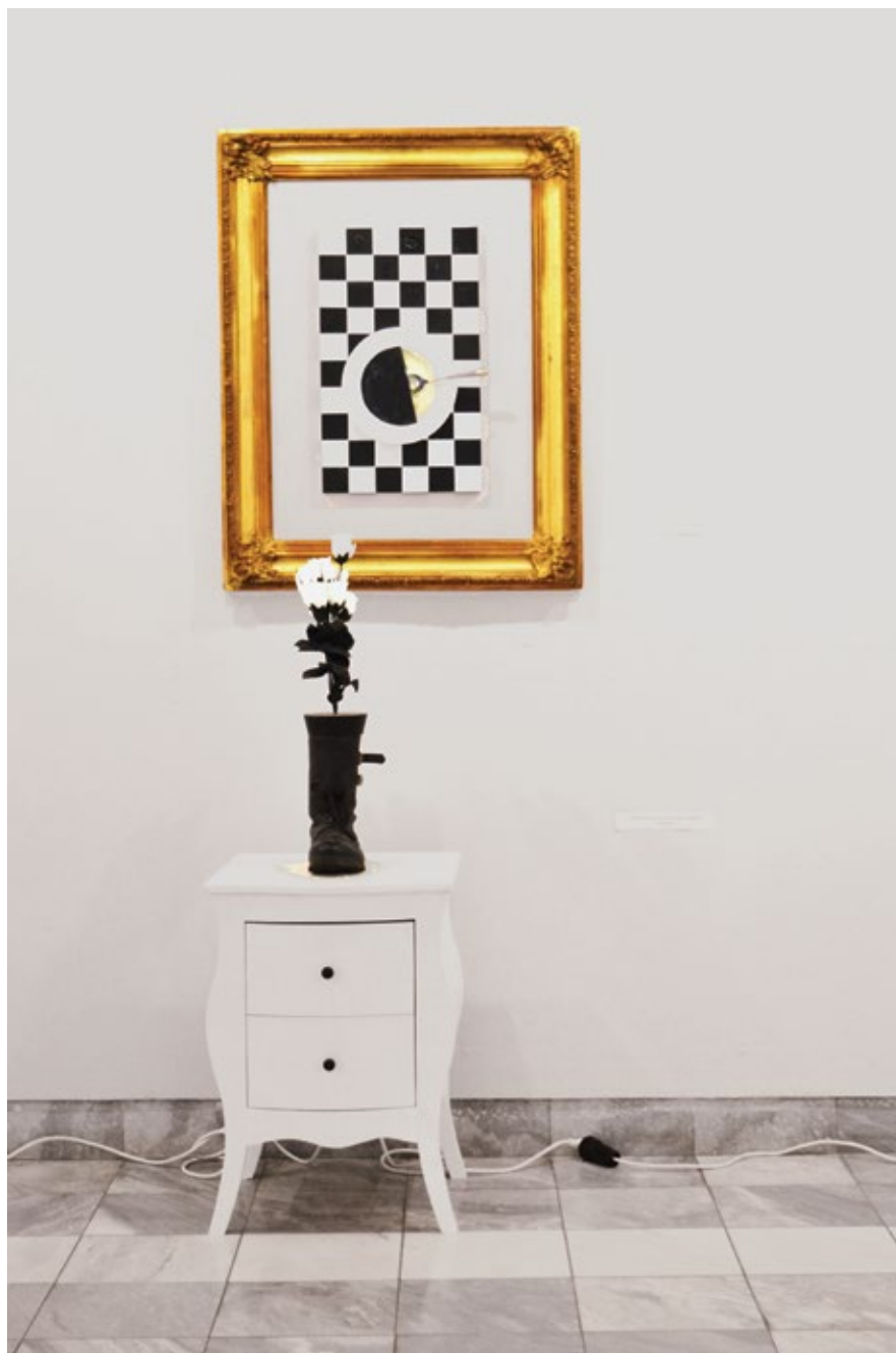
Комода за кабинет министра војног и Црно бели свет / Dresser for the Cabinet of the Minister of War and Black and White World 2022. и 2023, зидно просторни диптих, комбинована техника / space and wall diptych, mixed media