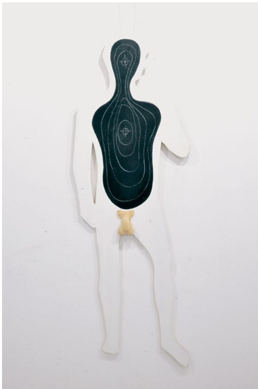
Чивилук за кабинет министра војног / Hanger for the Cabinet of the Minister of War 2022, акрил на дрвету / acrylic on wood, h 180 cm