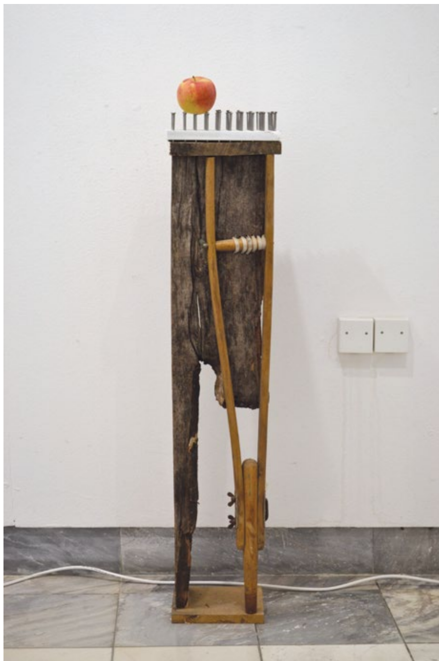
Сталак за кабинет министра војног / Rack for the Cabinet of the Minister of War 2020, склепатура / assamblage, h 110 cm