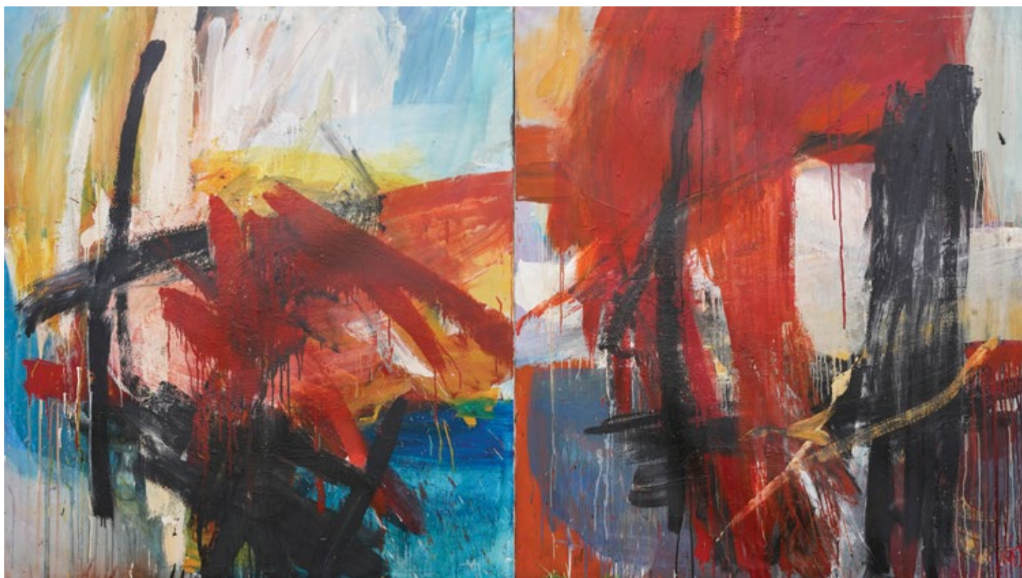
Преображај , 2020, уље на платну, 2 x 150 x 160 cm Transformation , 2020, oil on canvas, 2 x 150 x 160 cm