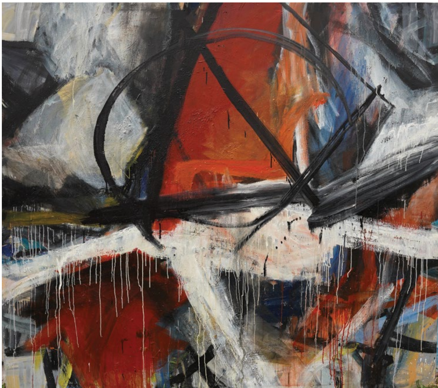
Анђео , 2019, уље на платну, 160 x 180 cm Angel , 2019, oil on canvas, 160 x 180 cm