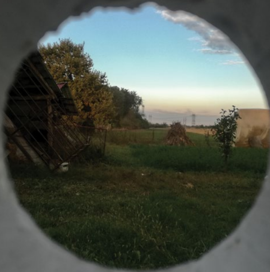
Пиктуралне инсталације, 2023, димензије променљиве Pictural Installations, 2023, variable dimensions