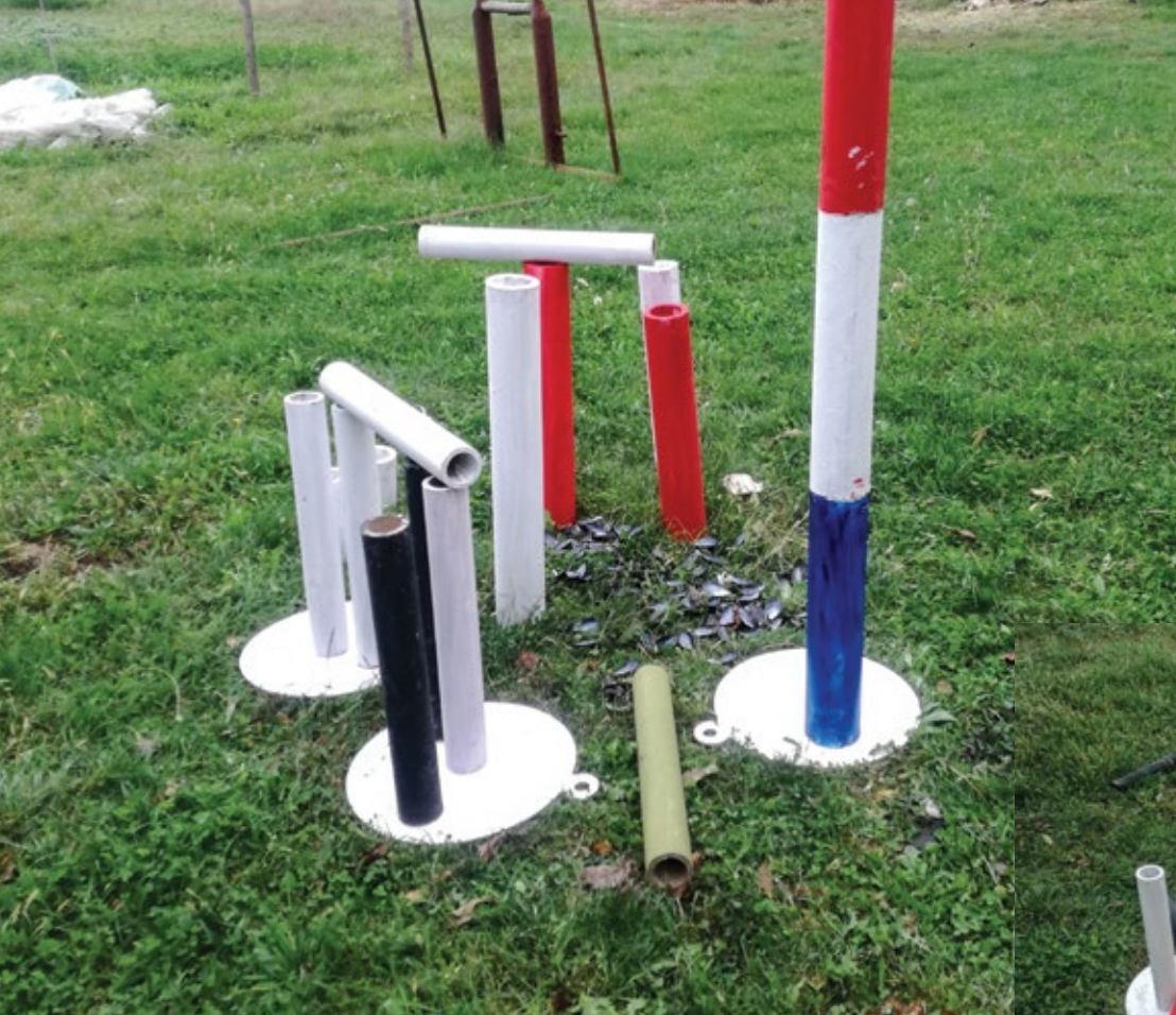
Пиктуралне инсталације, 2023, димензије променљиве Pictural Installations, 2023, variable dimensions