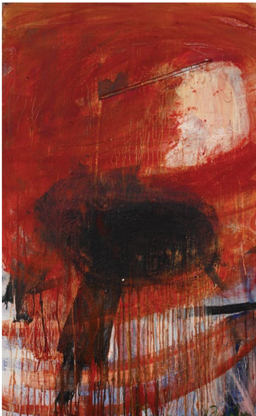
Без назива, 2022, уље на платну, 160 x 100 cm

Untitled, 2022, oil on canvas, 160 x 100 cm