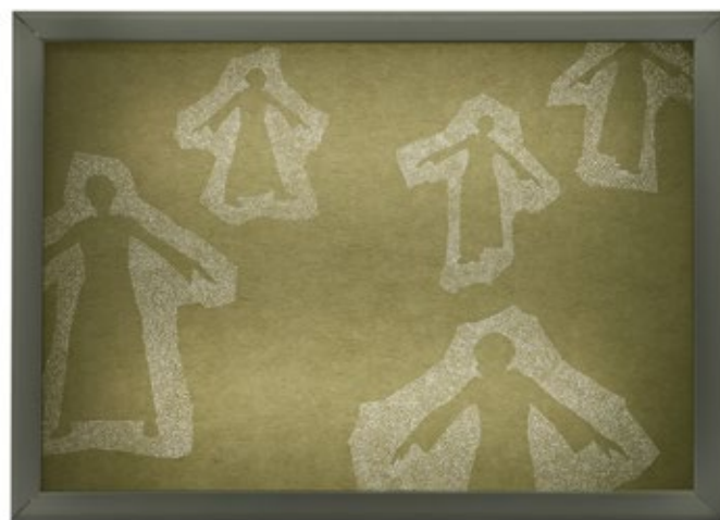
поставка изложбе у Продајној галерији Београд / просветљени цртежи настали перфорацијом белих папира the exhibition in the Gallery Belgrade / enlightened drawings were made by white perforated paper, details 2012.