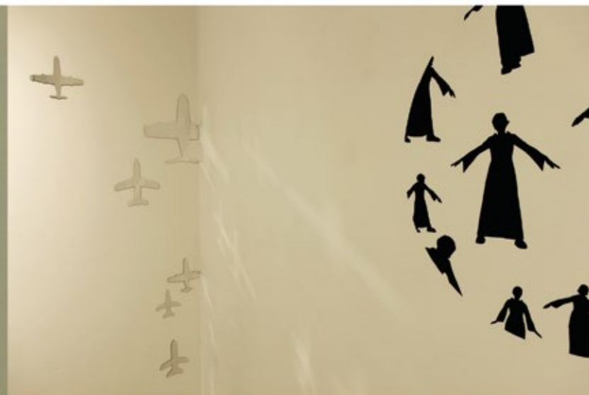
деталји апликација на зиду галерије, огледала и црни плиш details of application on the gallery walls, mirrors and black velvet