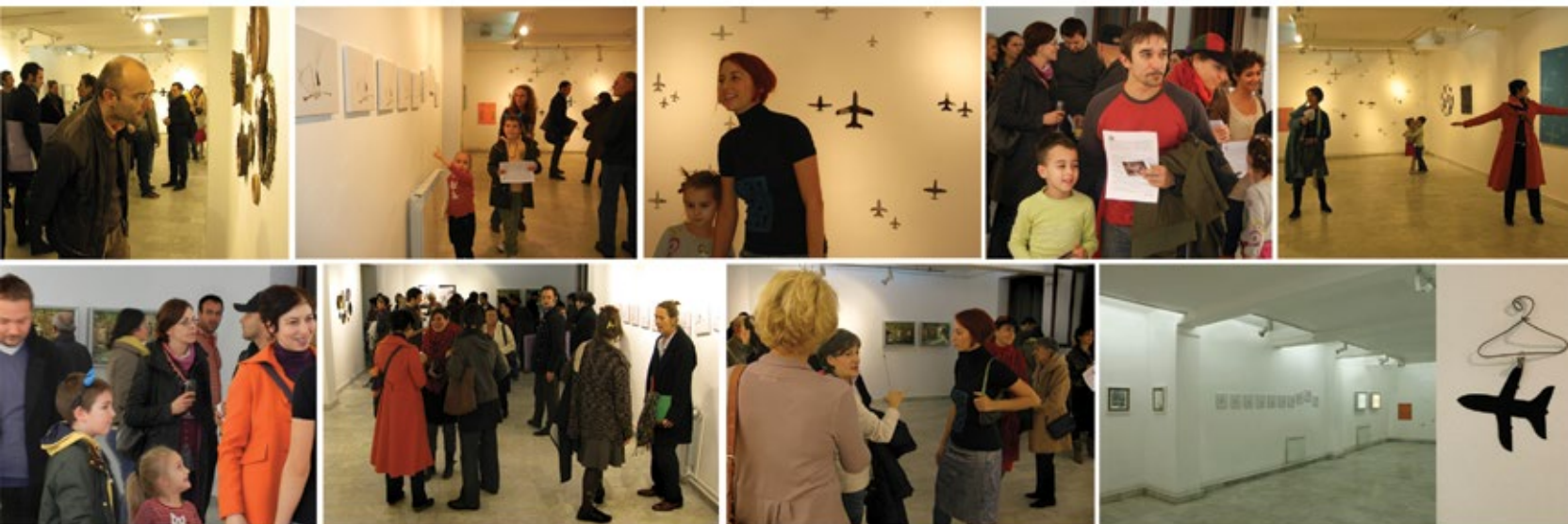
свечано отварање изложбе, петак, 9. новембар 2012. године opening night of the exhibition, friday, 9. november 2012. Belgrade