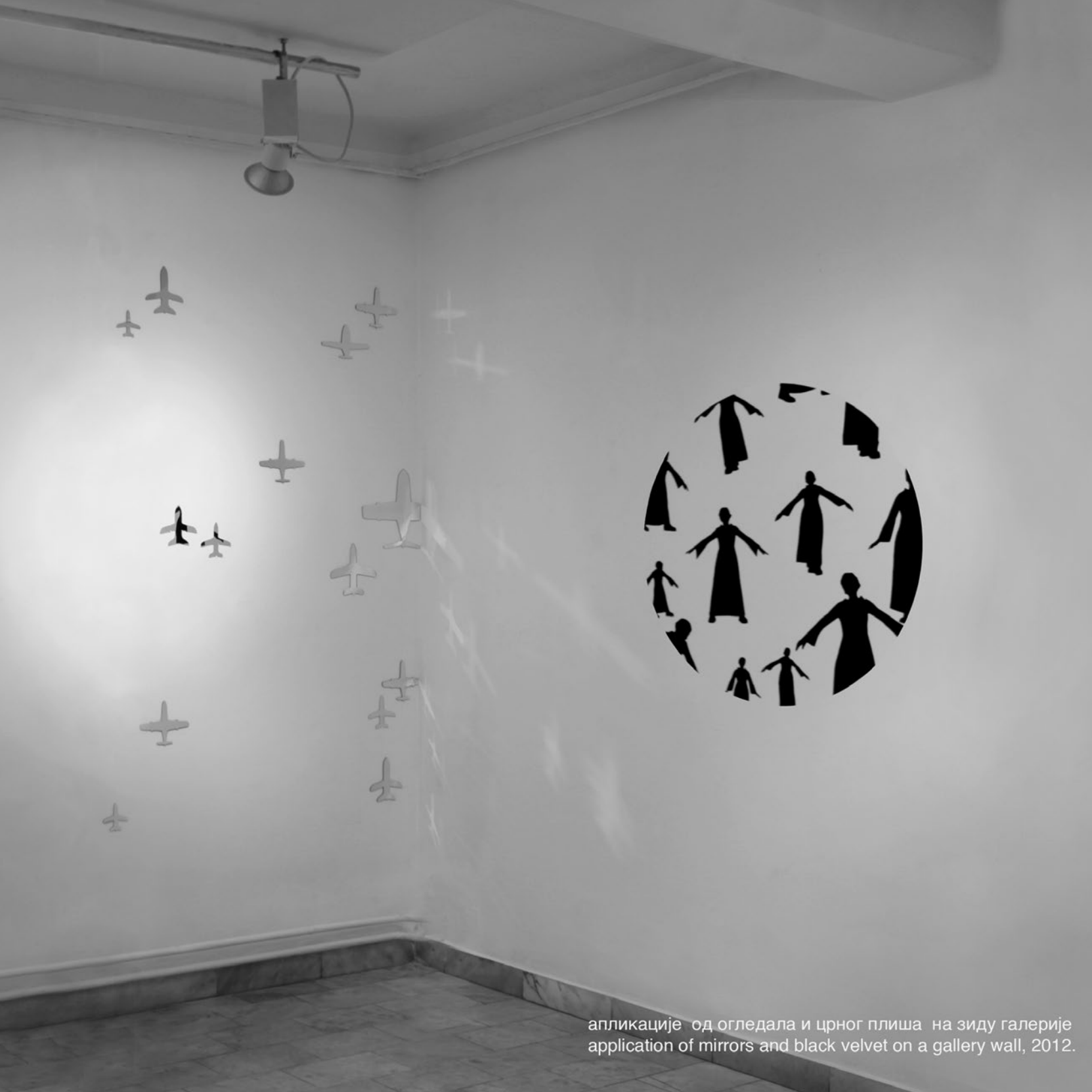
апликације од огледала и црног плиша на зиду галерије application of mirrors and black velvet on a gallery wall, 2012.