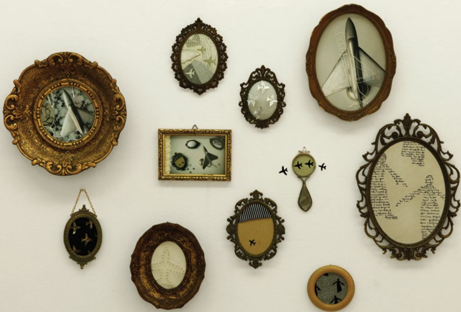
колажи у старим рамовима пронађени на београдским пијацама / новинска хартија, фотографија, вез, лио вата, ђленадле, чипка, плиш, рајснадле, огледало, рукопис... collages in old frames found in Belgrade market places / newsprint, photographs, embroidery, fabric cotton, pins, lace, black velvet, little thumbtacks, mirror, handwriting ... 2012.