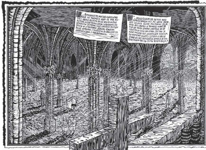
10. kvarex . iz dvanaest serijah umetnika M. Jandrić London 2012