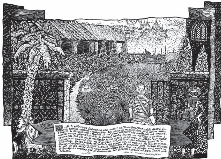
10. kvarex . iz dvanaest serijah umetnika J. Jandrić London 2012