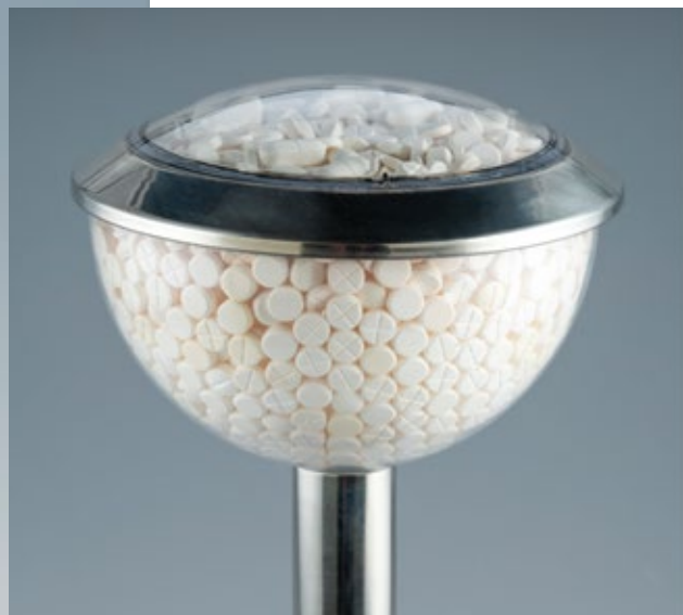
Контрола летења , 2008. метал, пластика, пилуле, 17 x 40 x 17 cm