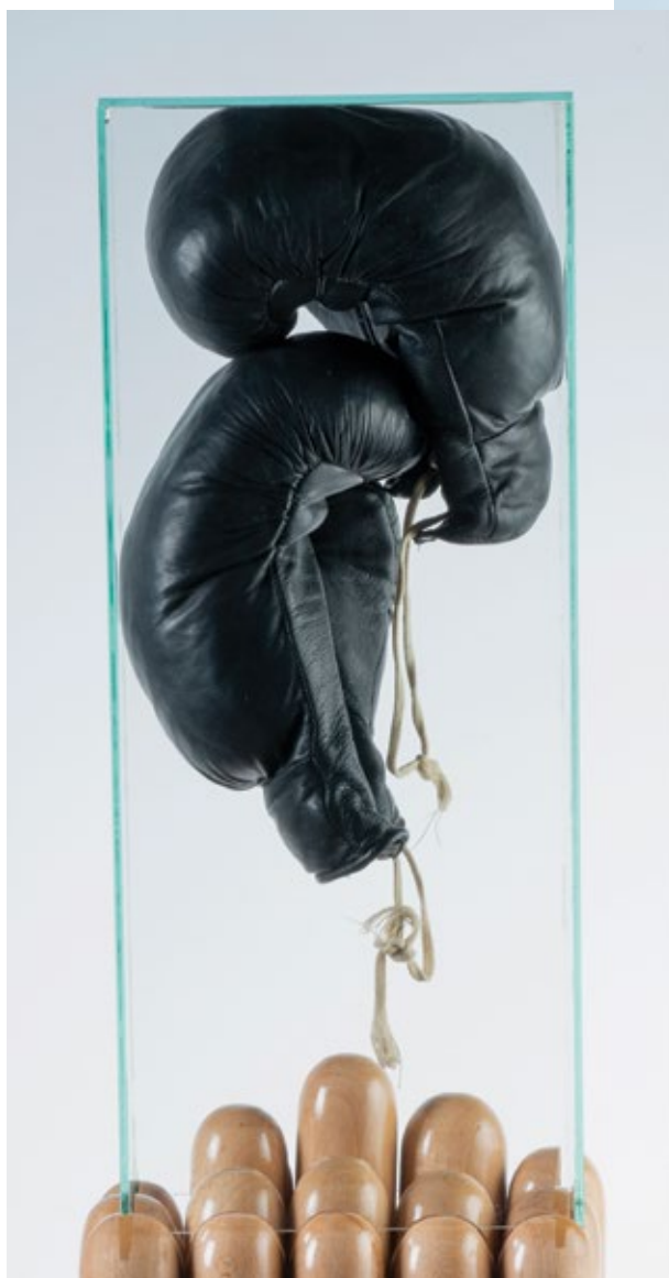
Само ударци даће стварима облик, 2021. рукавице за бокс, бејзбол палице, стакло, 120 x 20 x 24 cm

Only Blows Give Shape to Things , 2021 boxing gloves, baseball bats, glass, 120 x 20 x 24 cm