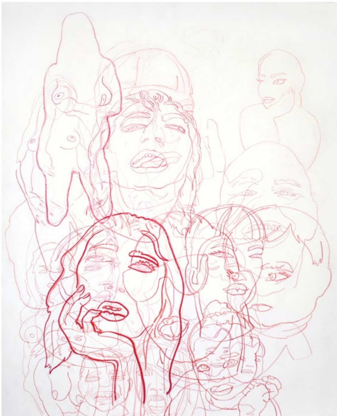
Ефемерне утопије, 2022, комбинована техника на папиру, 90x70cm

Ephemeral Utopias, 2022, mixed media on paper, 90x70cm