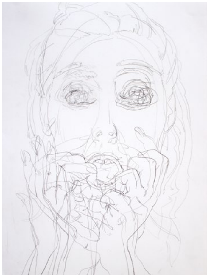
Из серије Људски облици , 2021, оловка на папиру, 45x35cm From Human Shapes series, 2021, pencil on paper, 45x35cm