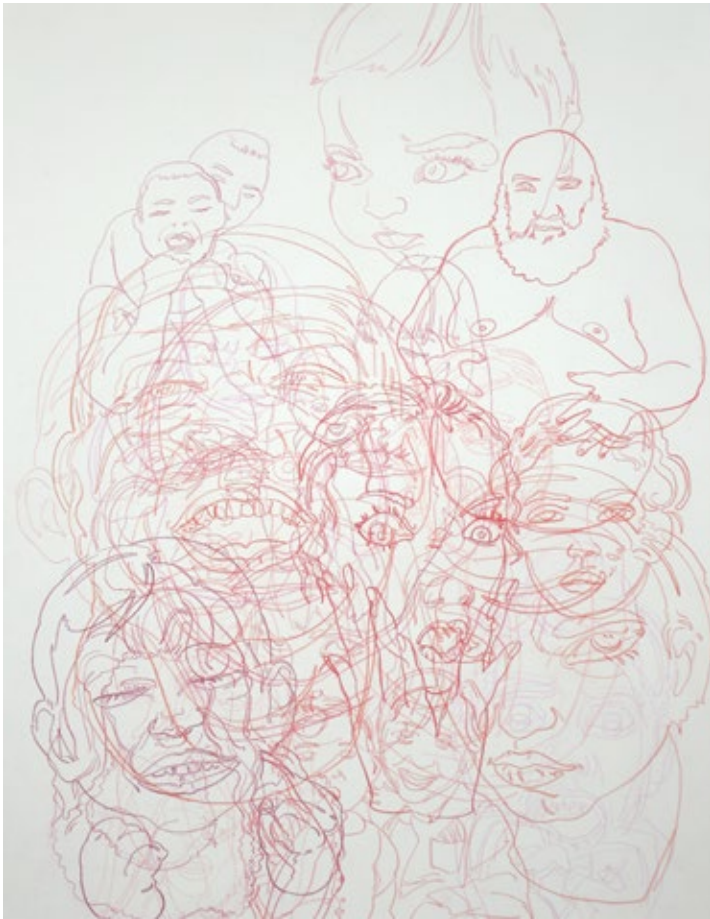
Из дигиталних утопија, 2022, комбинована техника на папиру, 70x50cm From Digital Utopias, 2022, mixed media on paper, 70x50cm