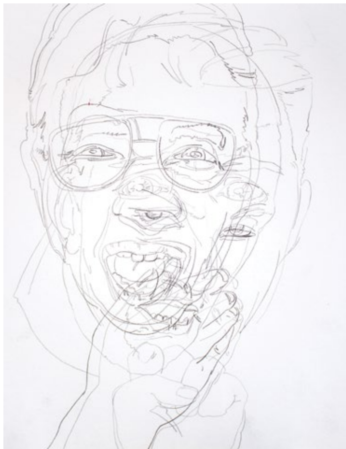
Из серије Људски облици , 2021, оловка на папиру, 45x35cm From Human Shapes series, 2021, pencil on paper, 45x35cm