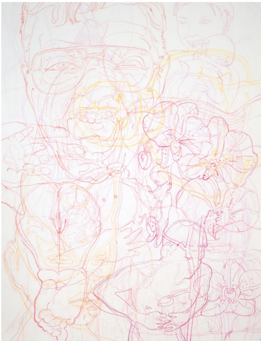
Из серије Људски облици , 2021, оловка у боји на папиру, 45x35cm From Human Shapes series, 2021, color pencil on paper, 45x35cm