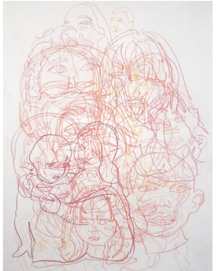
Из дигиталних утопија, 2022, комбинована техника на папиру, 70x50cm From Digital Utopias, 2022, mixed media on paper, 70x50cm