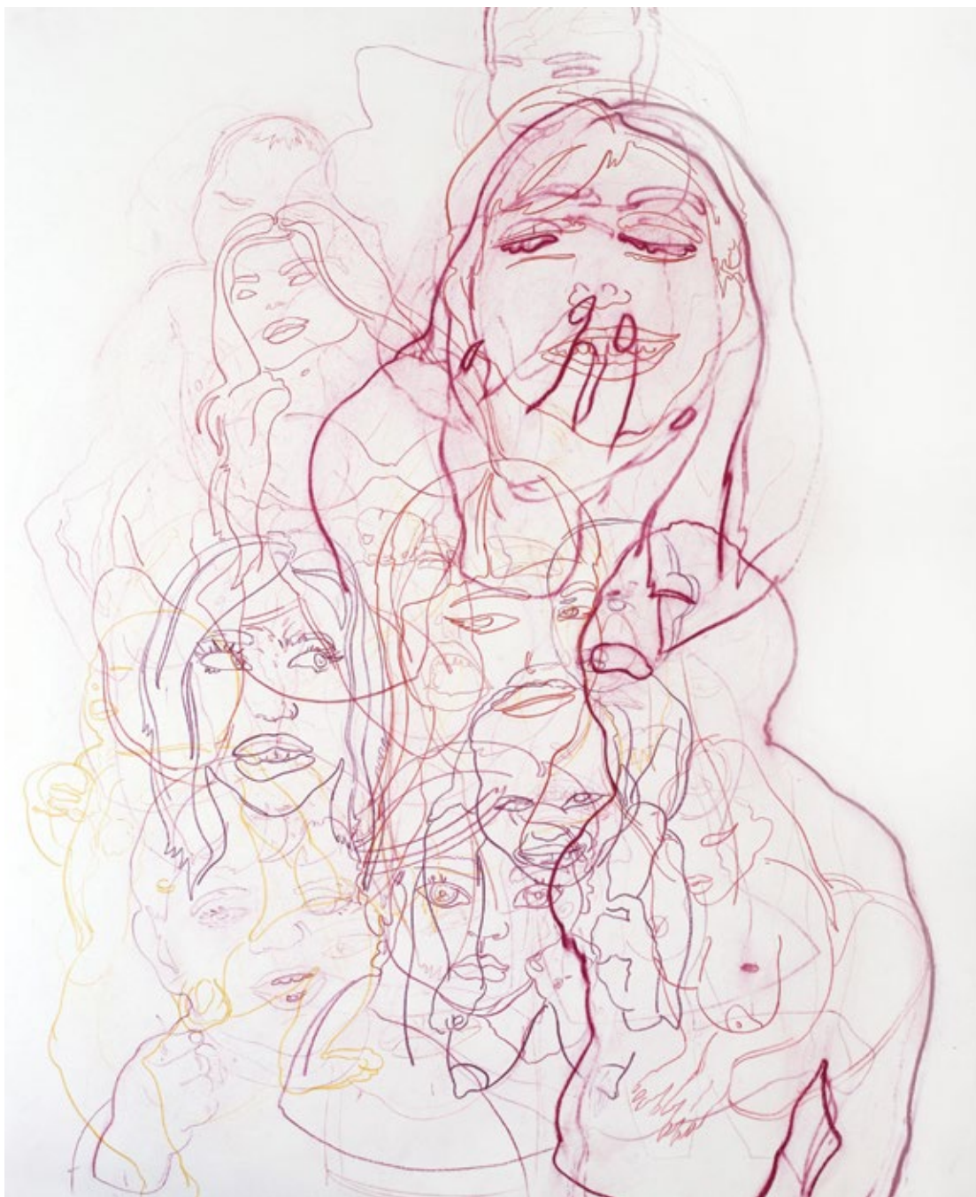
Ефемерне утопије, 2022, комбинована техника на папиру, 90x70cm