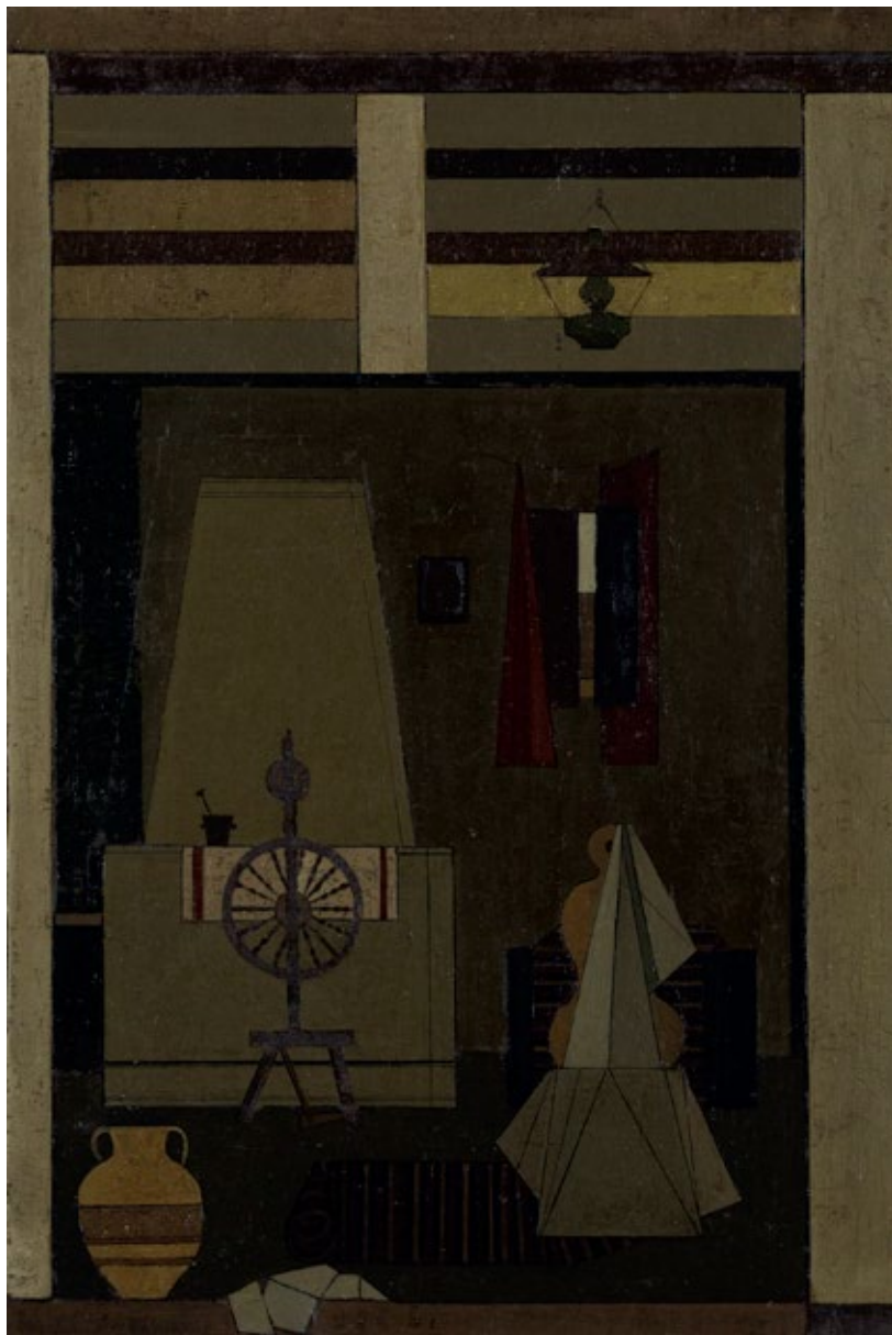
Ентеријер , уље на платну, 50x35cm Interior , oil on canvas, 50x35cm