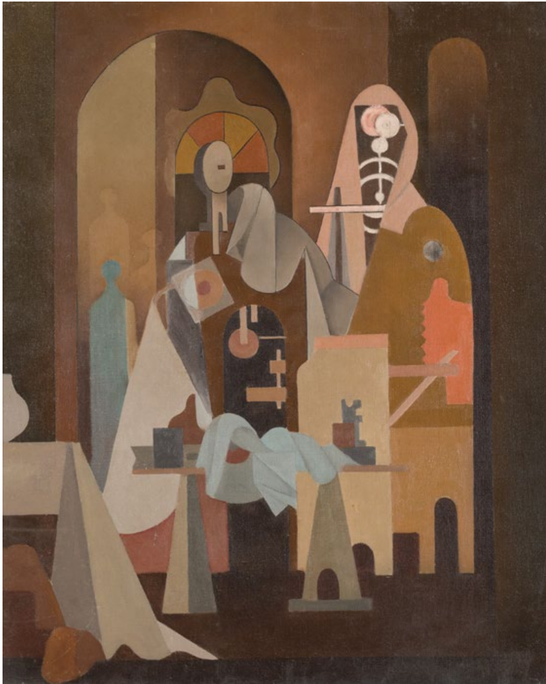
Фигуре, уље на платну, 72x60cm Figures, oil on canvas, 72x60cm