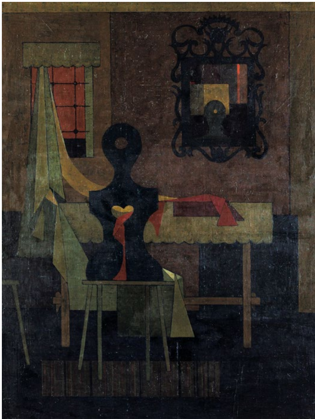
Пред огледалом, уље на платну, 85x66cm In Front of the Mirror, oil on canvas, 85x66cm