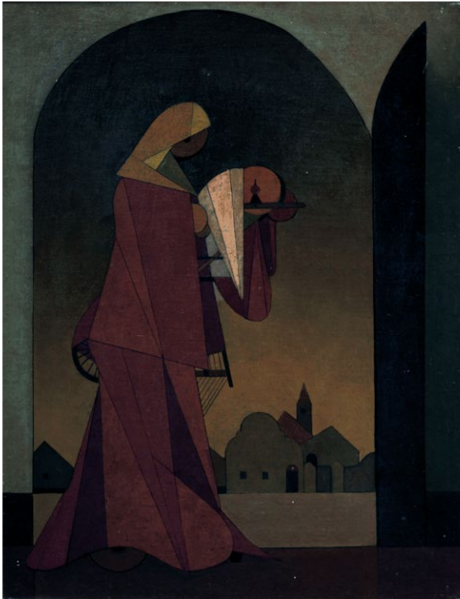
Фигура, уље на платну, 45x35cm