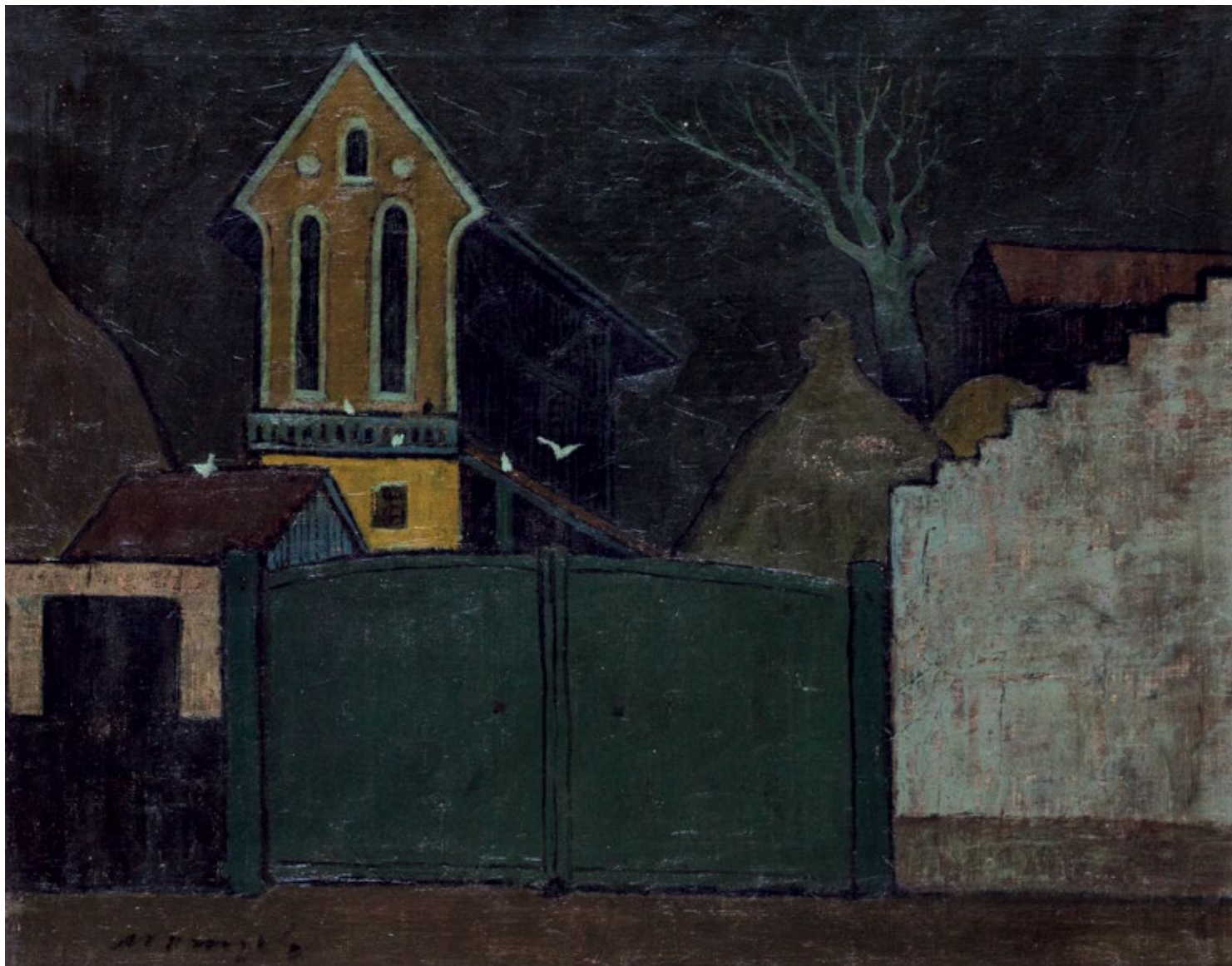
Капија и амбар, уље на платну, 50x62cm Gate and Barn, oil on canvas, 50x62cm