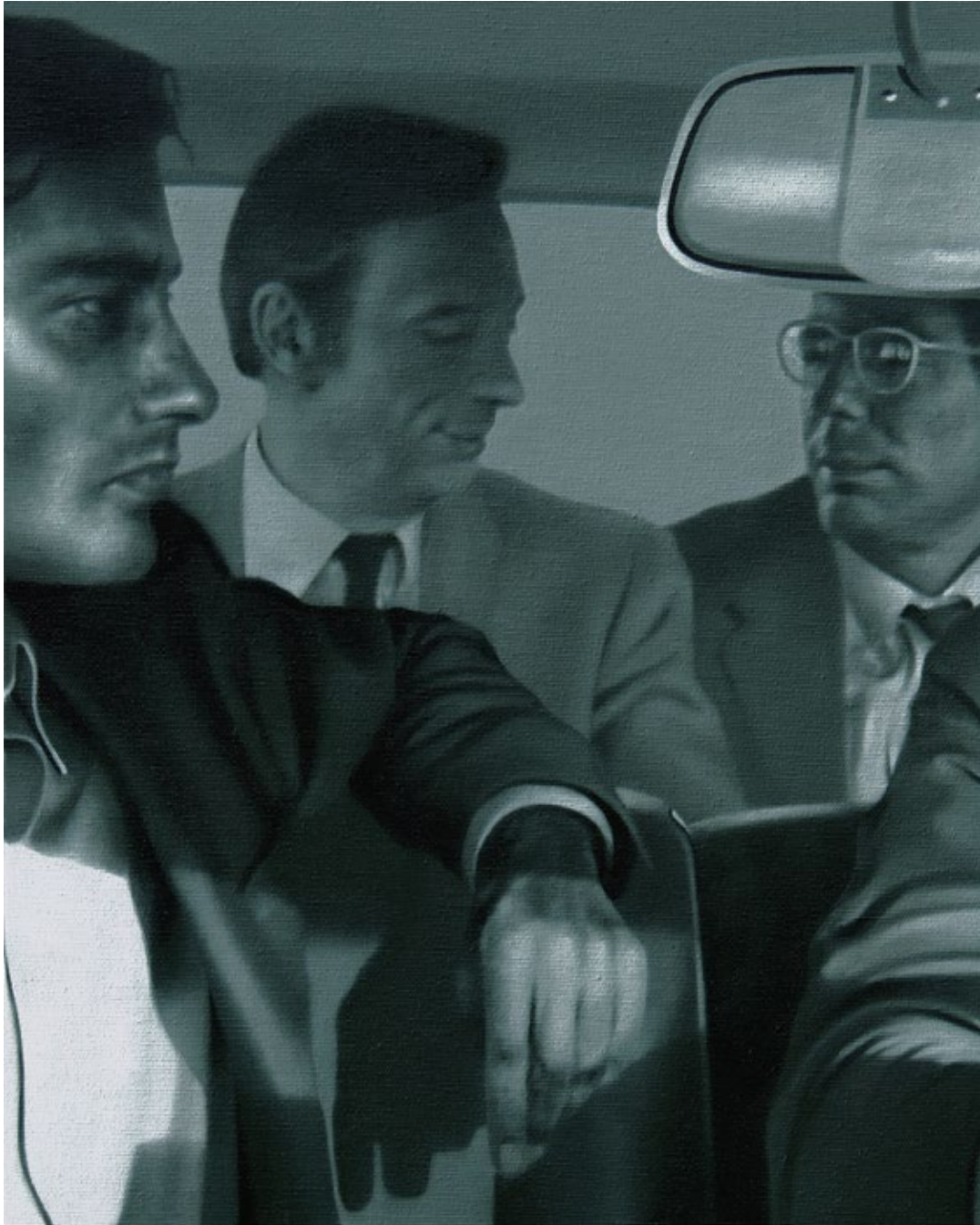
Nowhere Ride 2

2020, уље на платну / oil on canvas, 50×40 cm