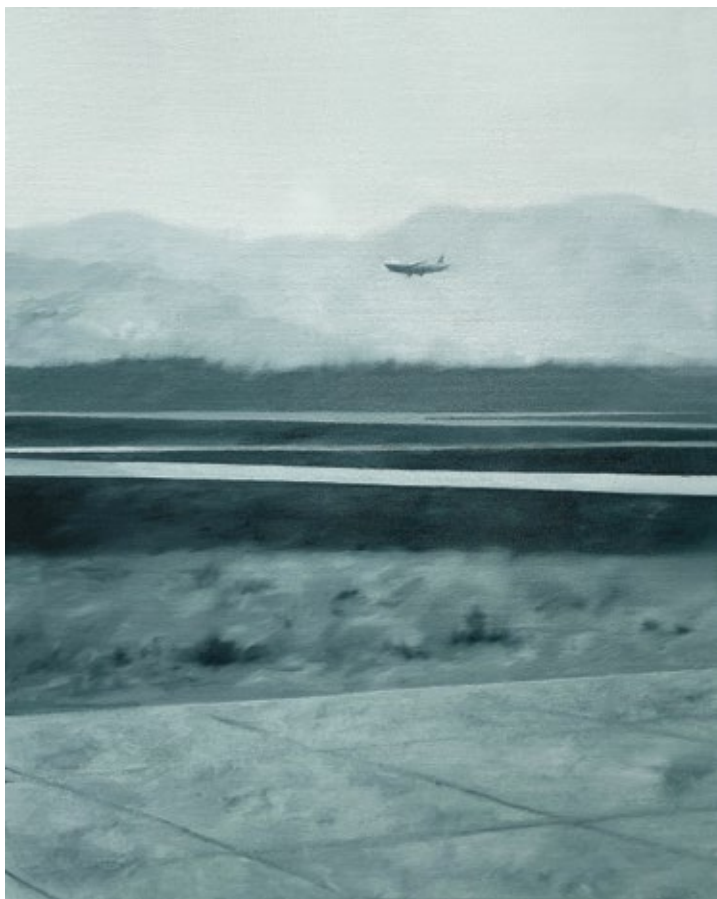
Phantom Flight 2022, уље на платну / oil on canvas, 50×40 cm