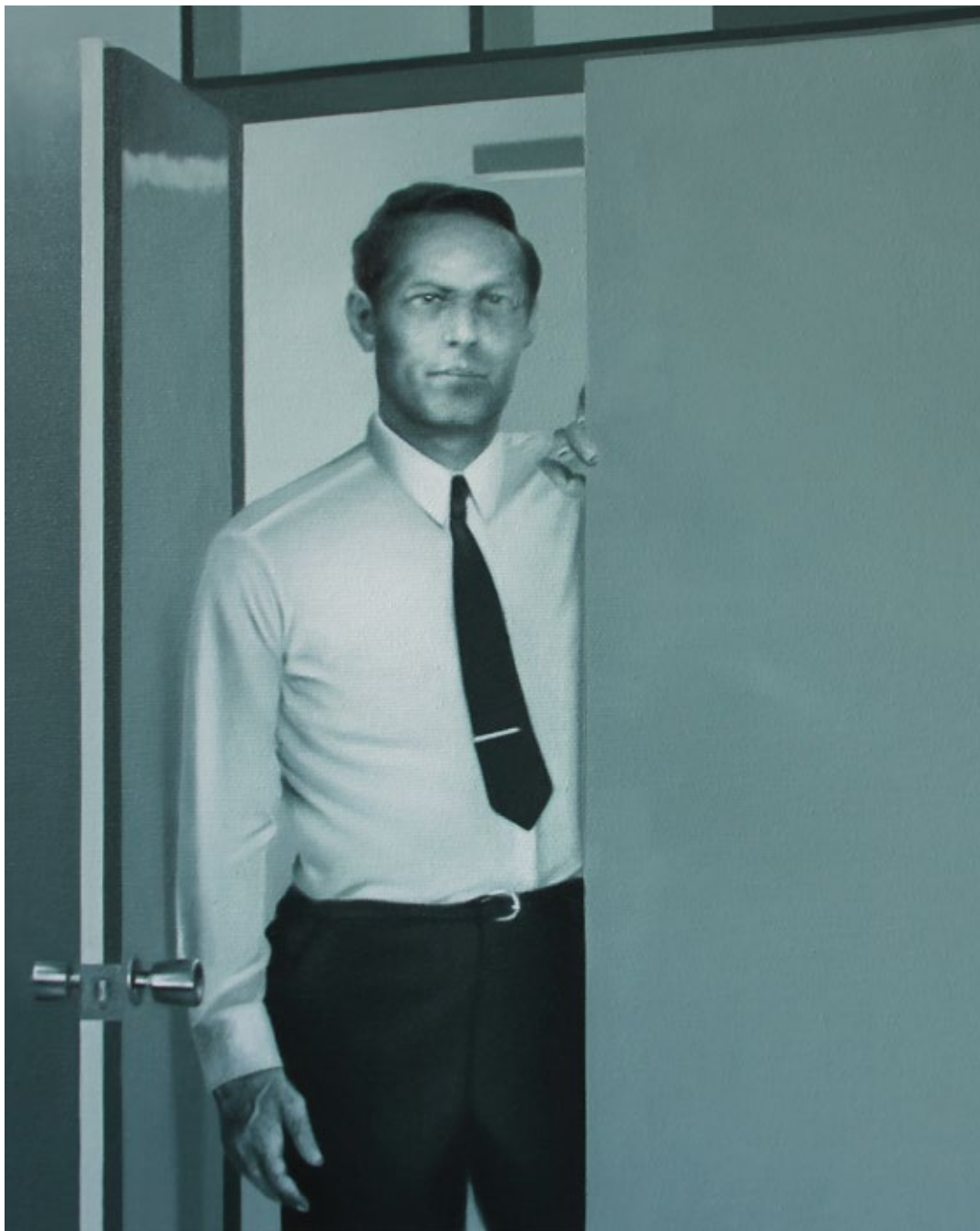
The Bystander 2020, уље на платну / oil on canvas, 50×40 cm