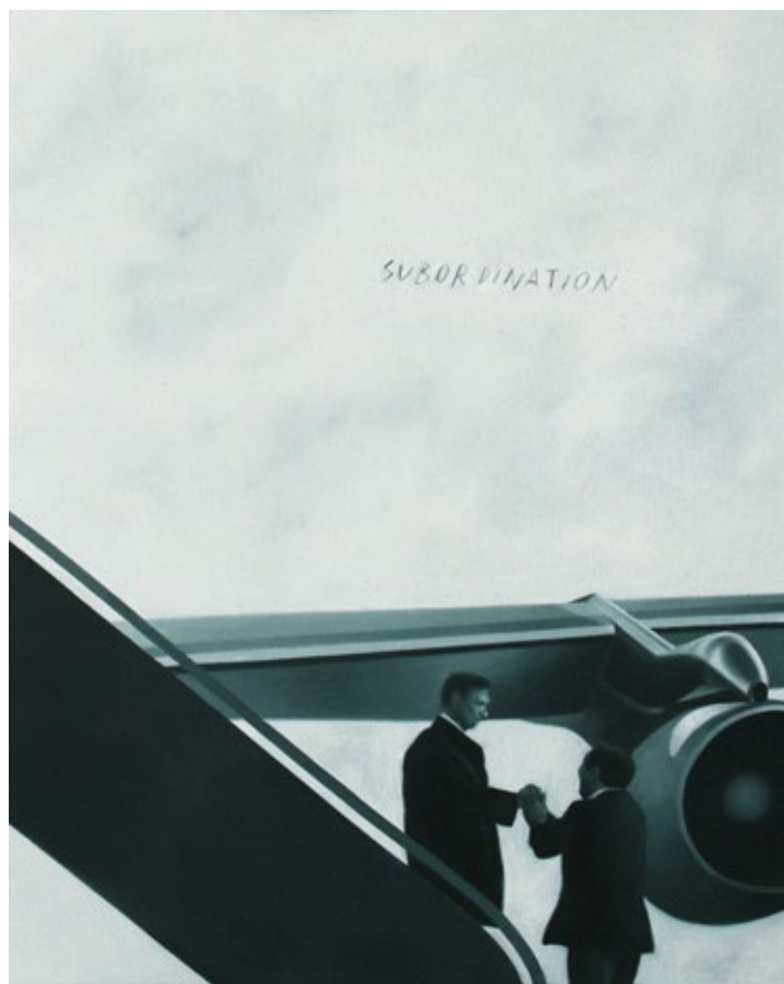
Subordination 2 2022, уље на платну / oil on canvas, 50×40 cm