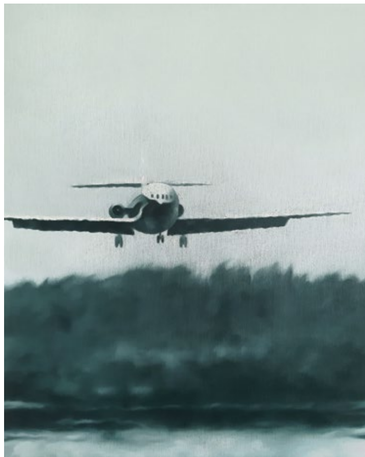
Без назива / Untitled 2022, уље на платну / oil on canvas, 50×40 cm