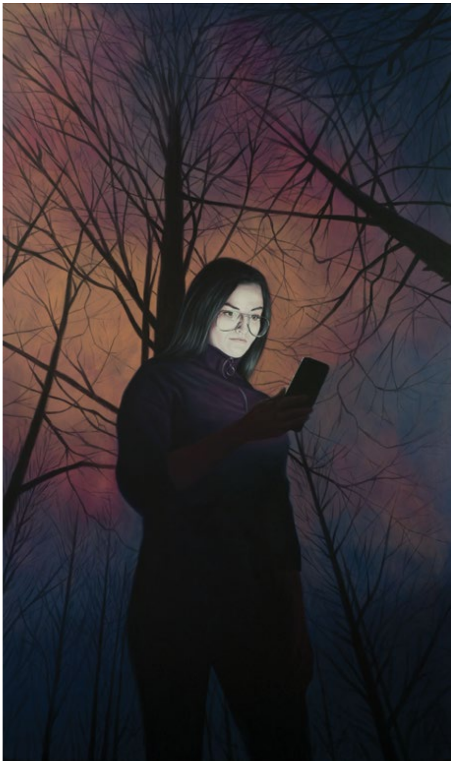
Smartphone Light 27

2022, уље на платну / oil on canvas, 200x120 cm