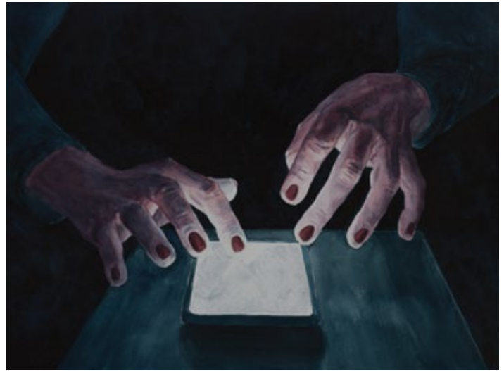
Smartphone Light (Magic Touch) 3 2021, акварел на папиру / watercolor on paper, 30x40 cm