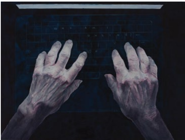
Laptop Light (Magic Touch) 1 2021, акварел на папиру / watercolor on paper, 30x40 cm