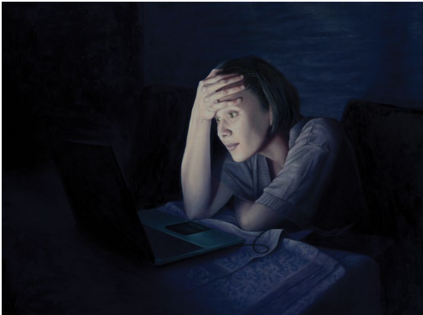
Laptop Light 10

2021, уље на платну / oil on canvas, 90x120 cm