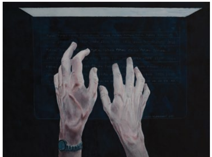
Laptop Light (Magic Touch) 2 2021, акварел на папиру / watercolor on paper, 30x40 cm