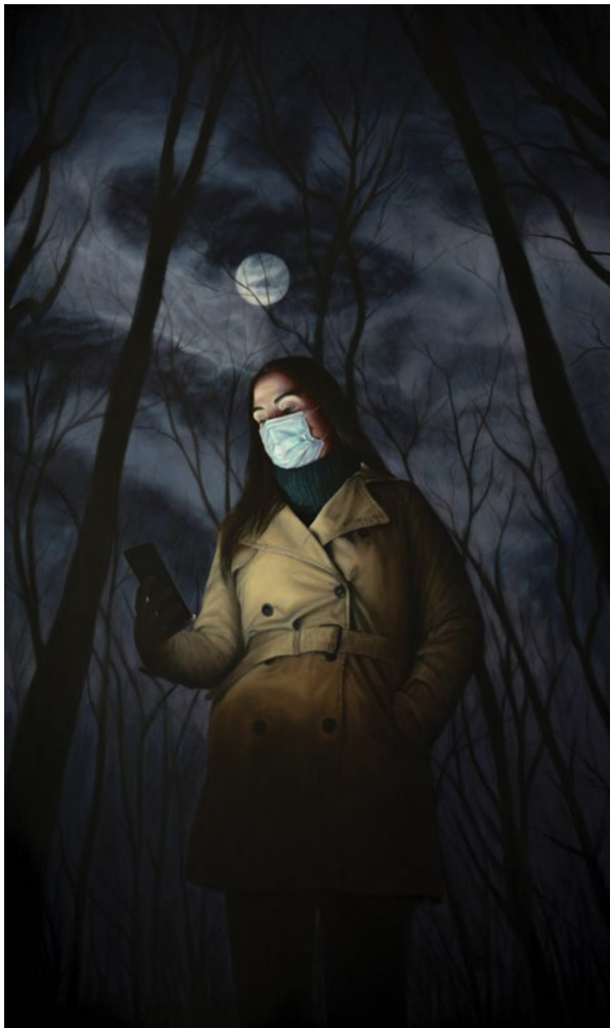
Smartphone Light 20

2020, уље на платну / oil on canvas, 200x120 cm