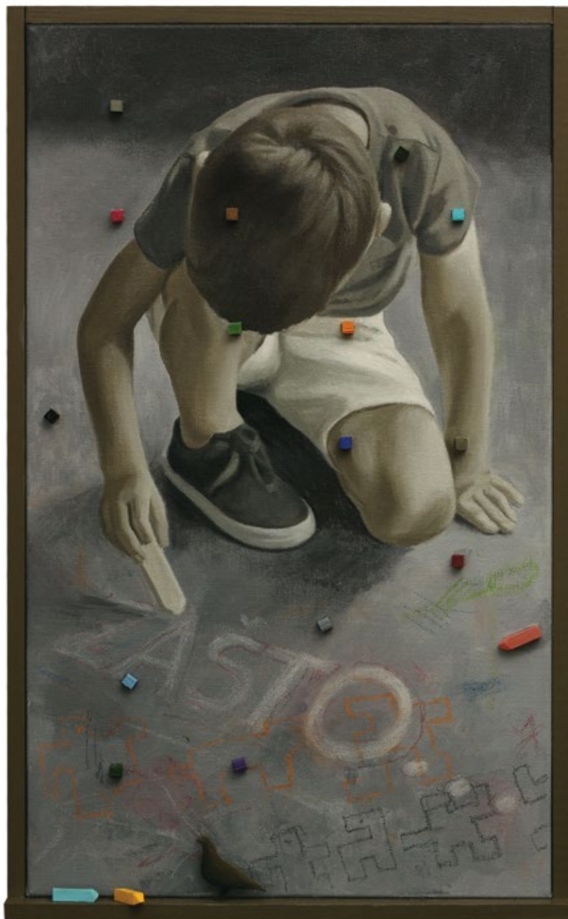
Храна за голубове / Pigeon Food уље на платну / oil on canvas 2020, 52x32 cm