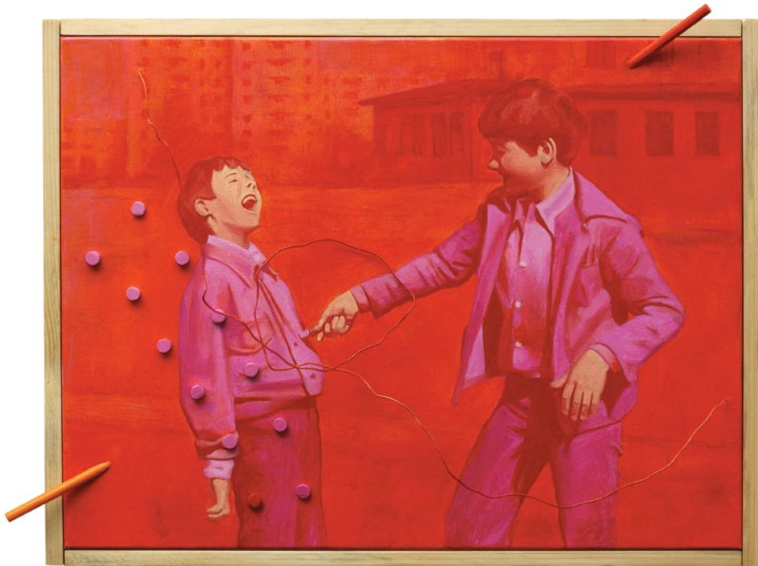
У школи / In the School уље на платну / oil on canvas 2018, 30x40 cm