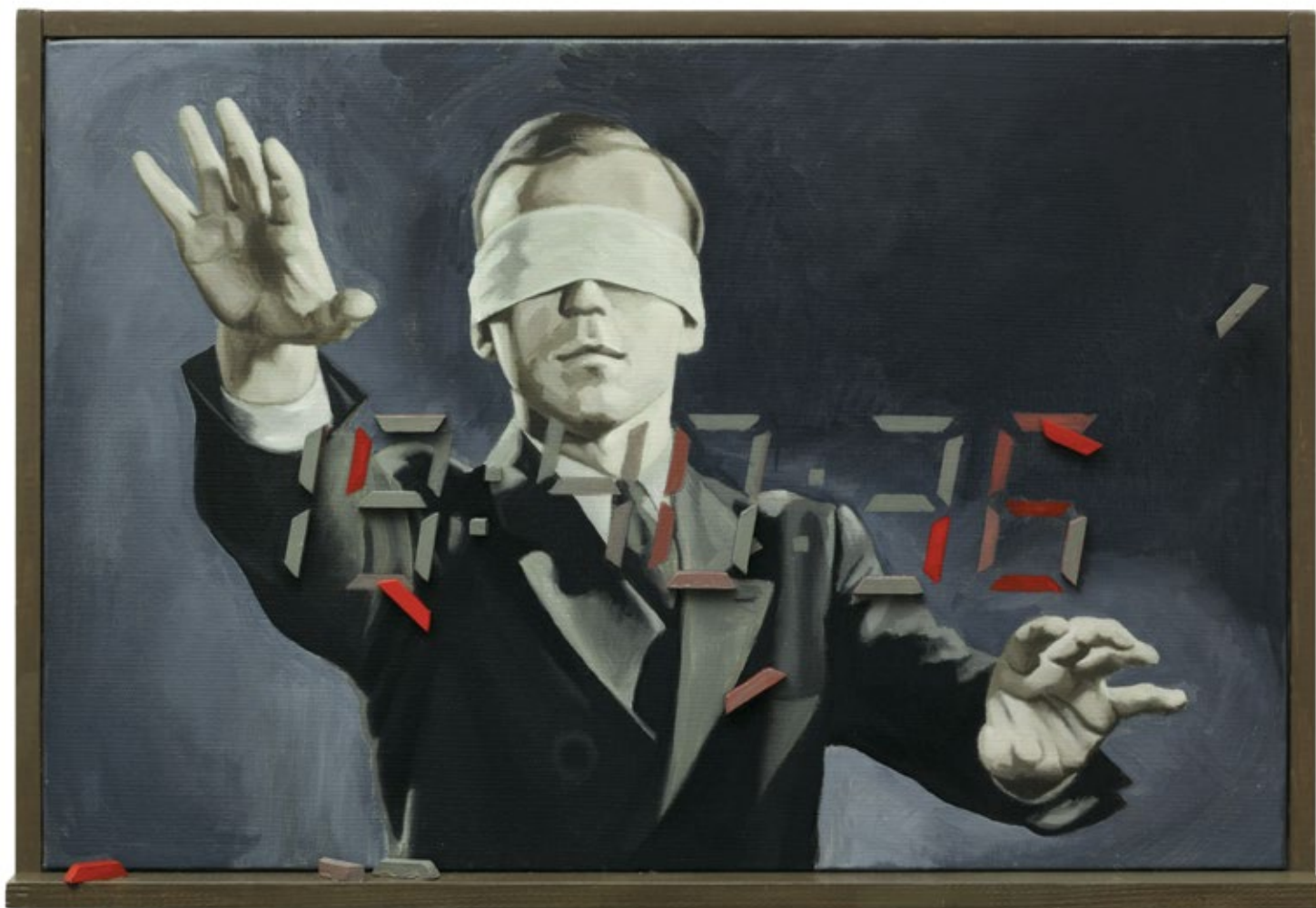
Време, време / Time, Time уље на платну / oil on canvas 2019, 32x47 cm