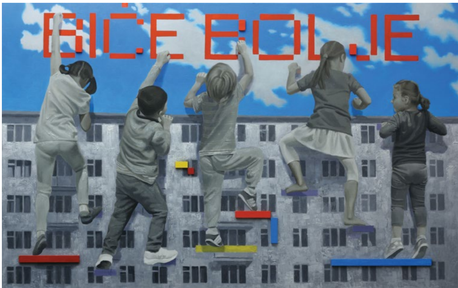
Држање за облаке / Holding on to the Clouds уље на платну / oil on canvas 2019, 90x144 cm