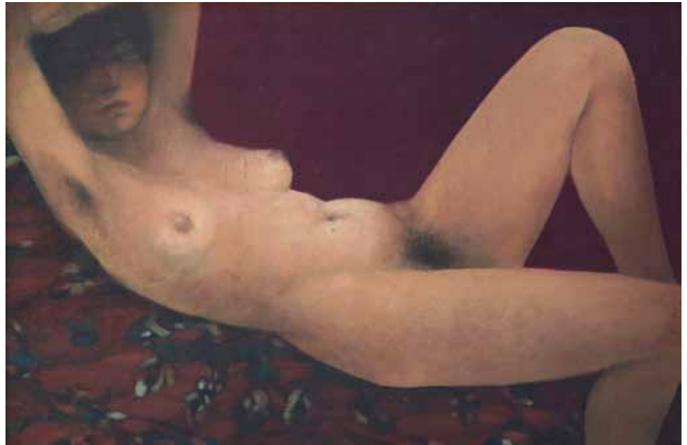
Драгана Јовчић Акт, 1978. уље на платну, 27 x 40 cm