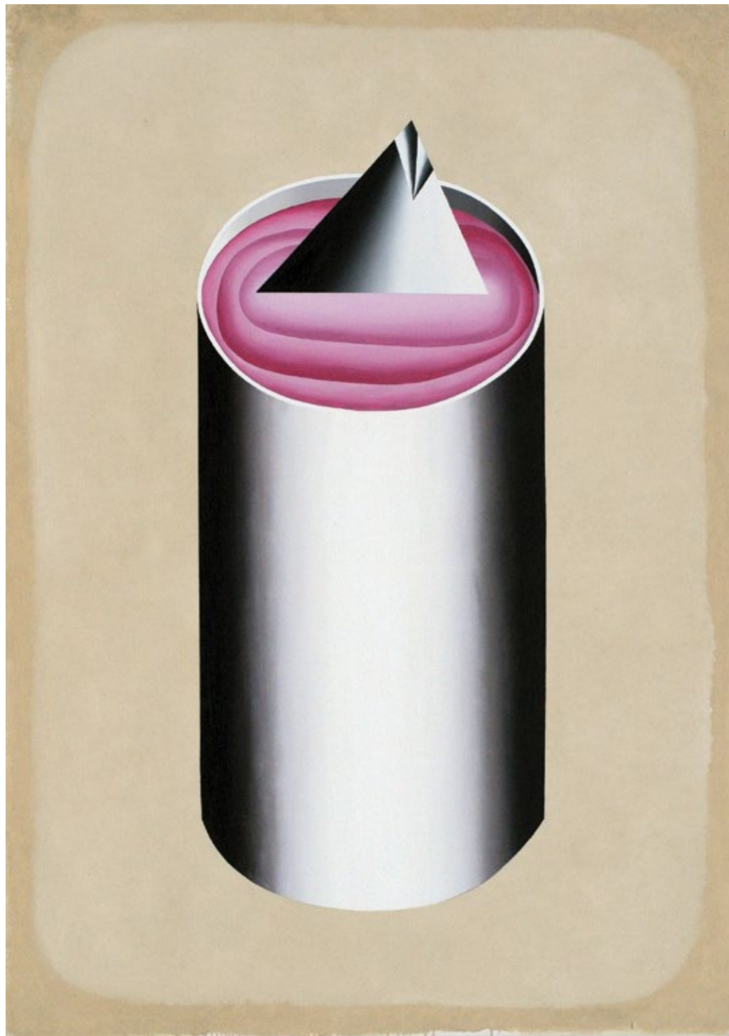
Туна 2014, 170x120cm, уље на платну