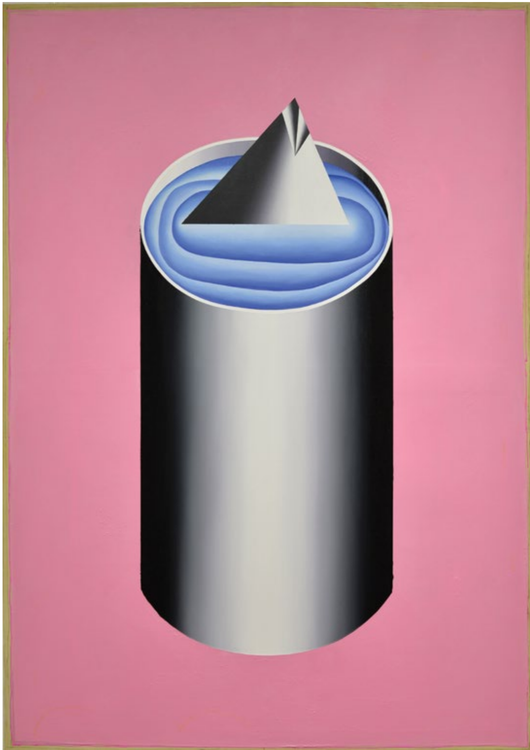
Розе тунa 2016, 170x120cm, уље на платну