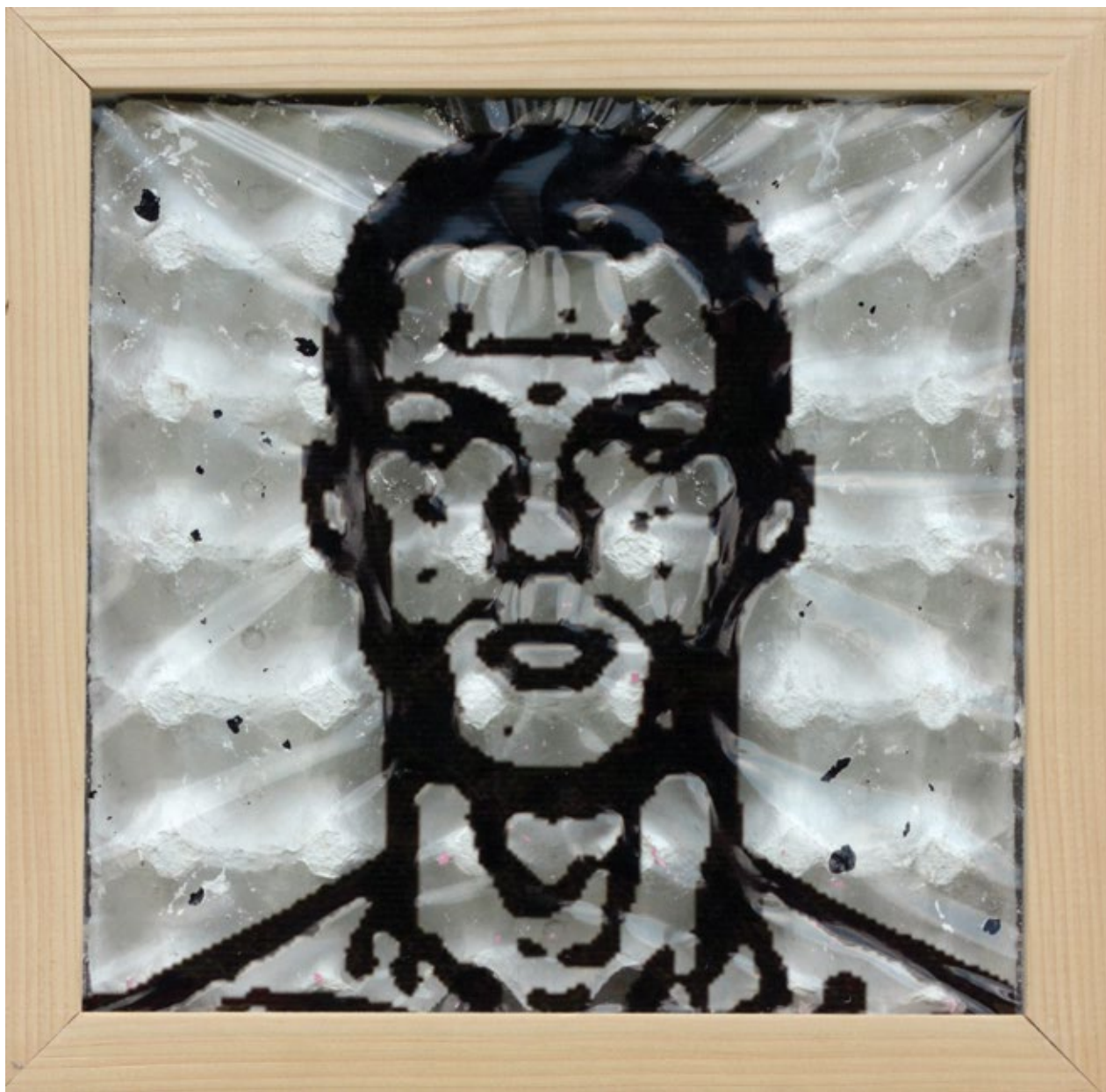
ЦР7 2015, 30x30cm, комбинована техника