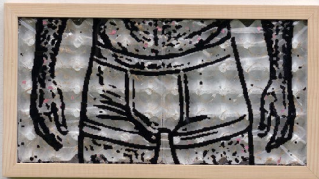
Underwear 2015, 60x60cm, комбинована техника