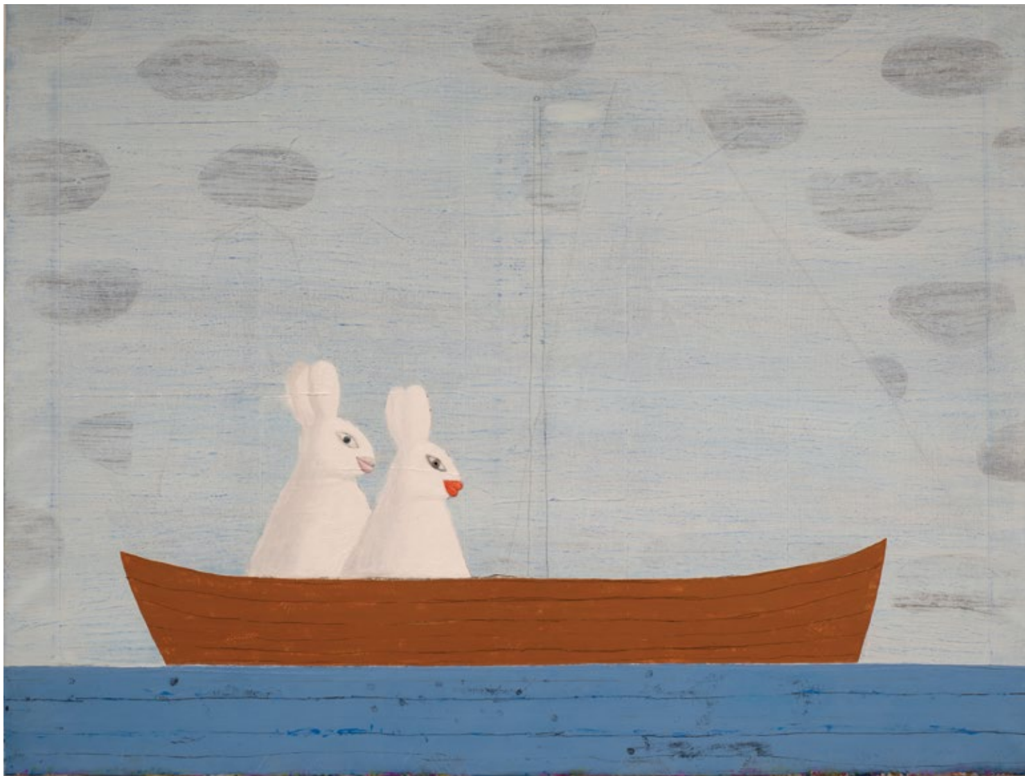
Лубав на води 2016, 900x120cm, уље на платну