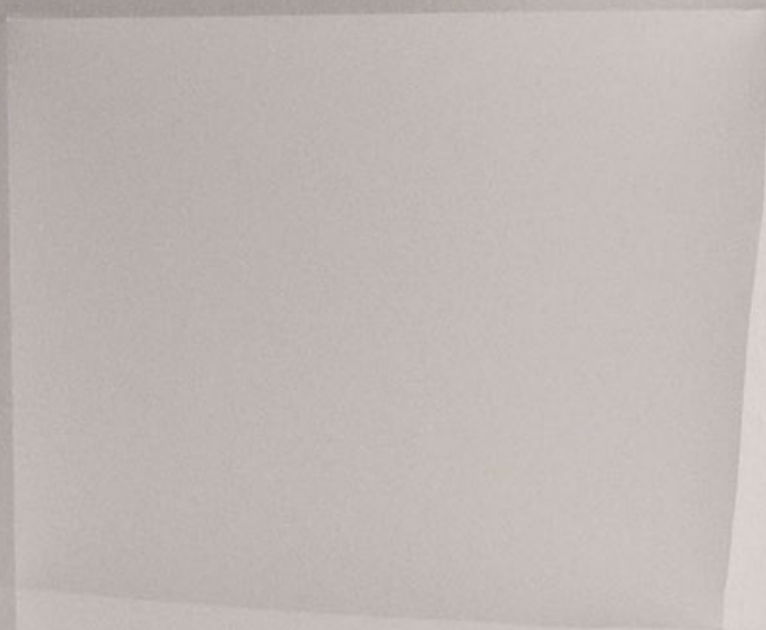
Марко Вукша sculpture drawing