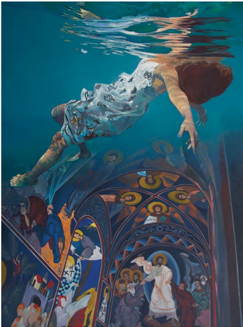
Препуштање 2018, уље на платну, 200 x 150 cm