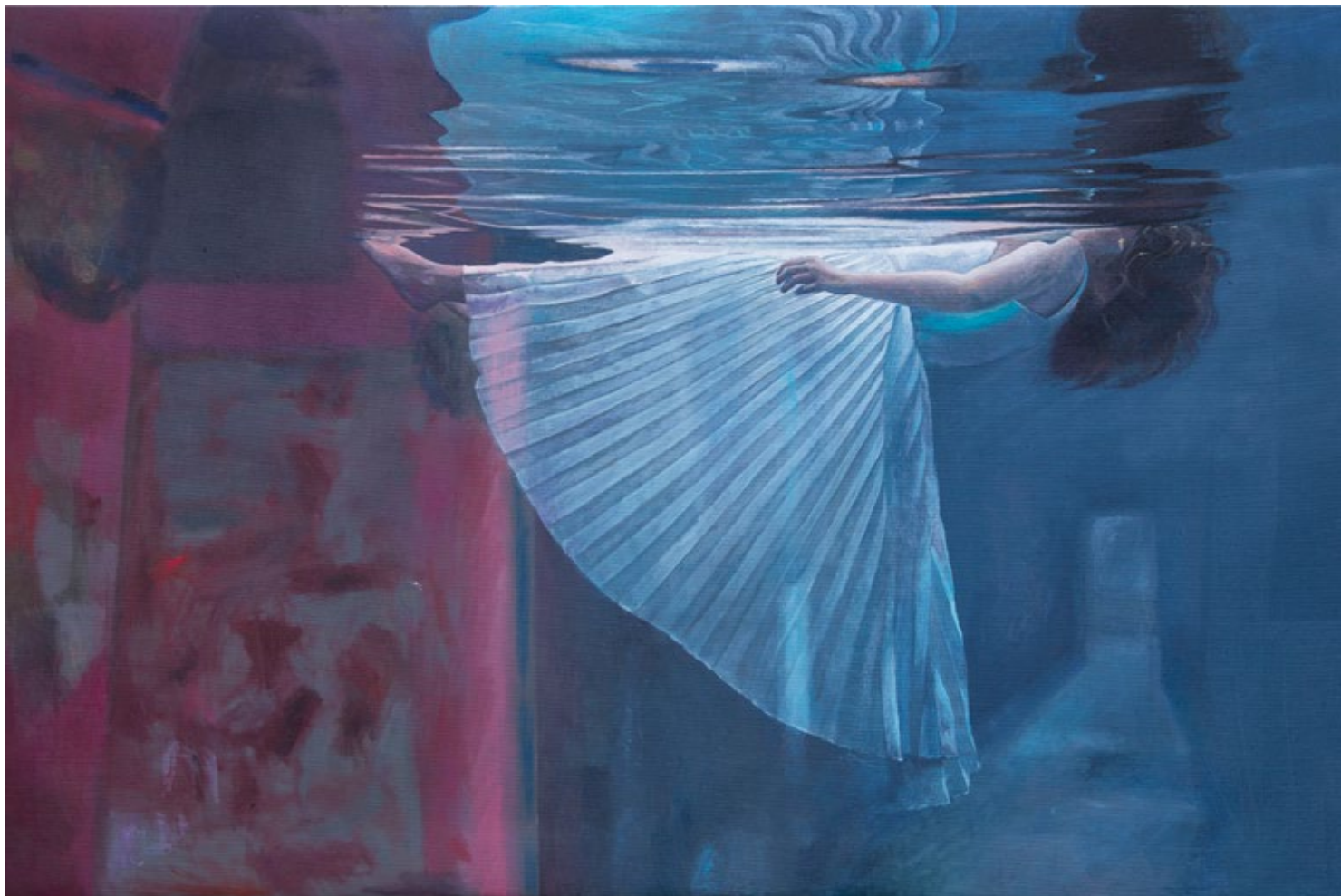
Плисе 2019, уље на платну, 150 x 240 cm