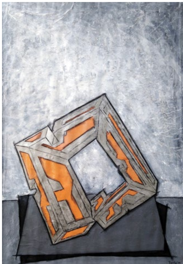
Брзина 2 , 2019. акрилне боје, угљен, 100x70 cm