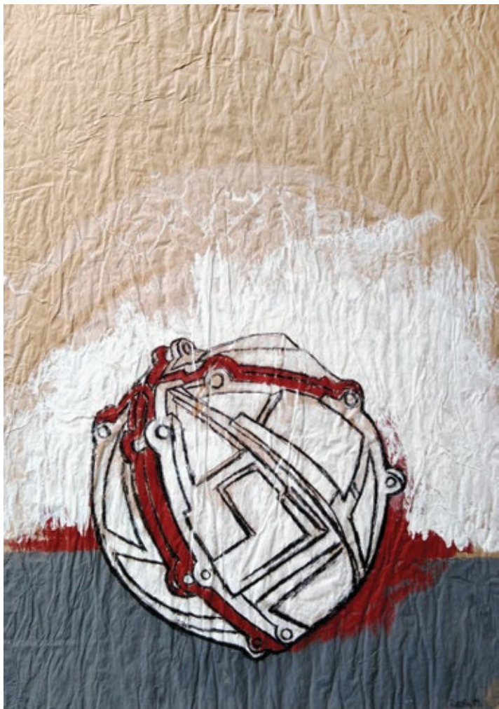
Порука , 2019. акрилне боје, угљен, 120x90 cm