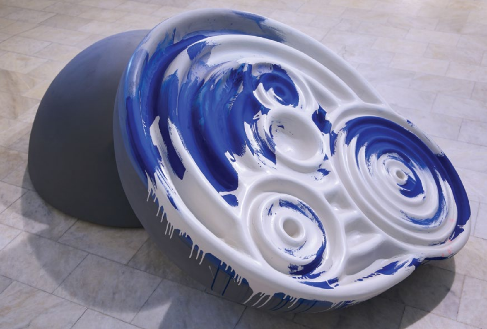
Заустављено време , 2019. бетон, боја, 200x120x105cm