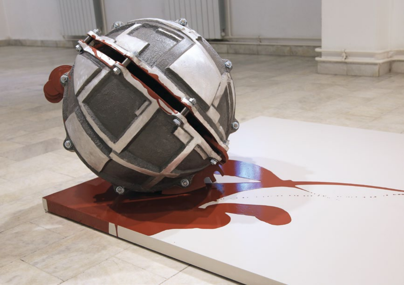
Poruka , 2019. алуминијум бојени, метал, дрво,, 120x120x70 cm