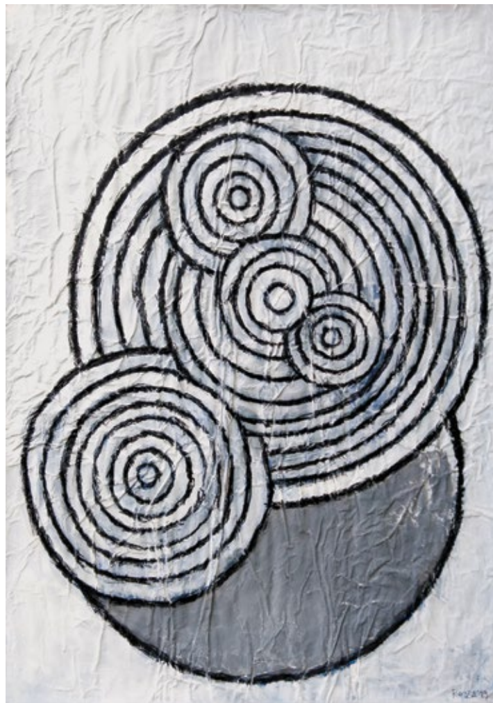
Заустављено време , 2019. акрилне боје, угљен, 100x70 cm