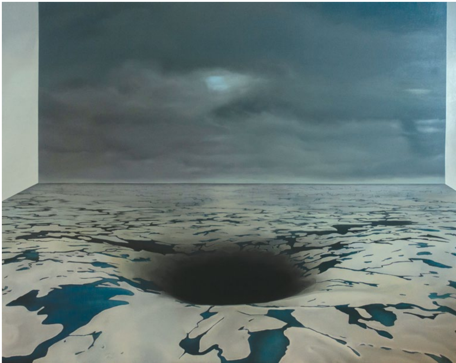
Tuxo / Silent 2019, уље на платну / oil on canvas, 200x160 cm