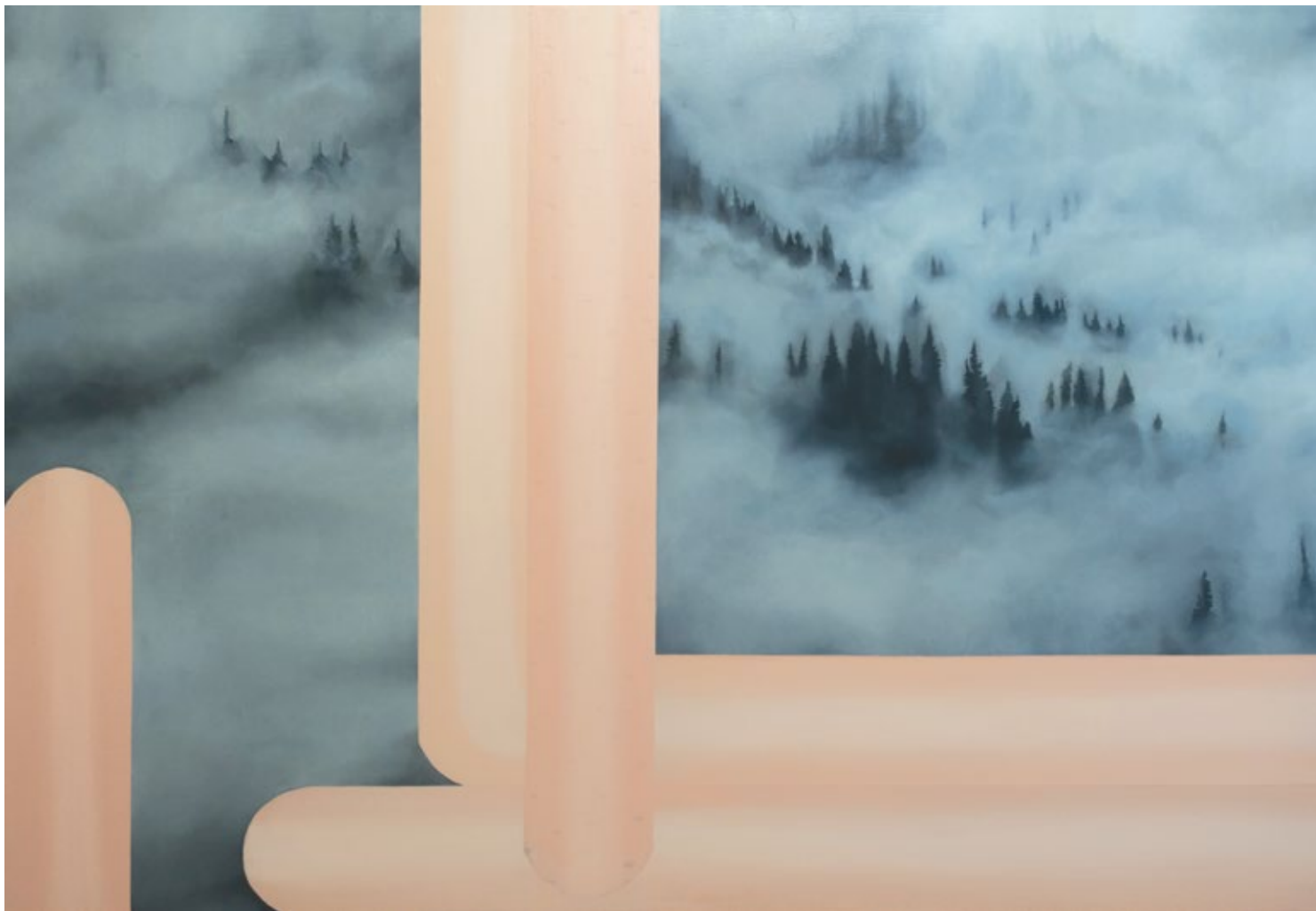
Магловито / Foggy 2018, уље на платну / oil on canvas, 160x110 cm