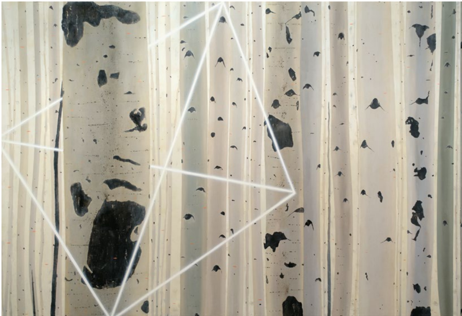
Скривено / Hidden 2018, уље на платну / oil on canvas, 320x110 cm