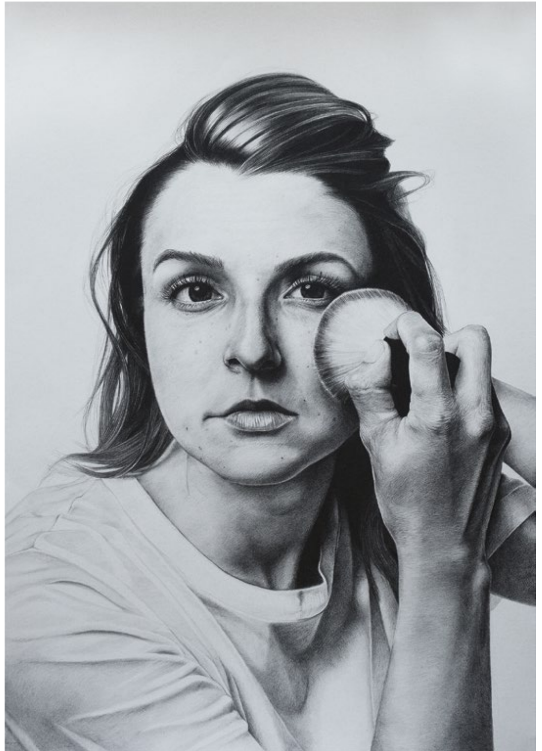
Соња Шурбатовић Таштина 2017, 100x70cm, оловка на папиру