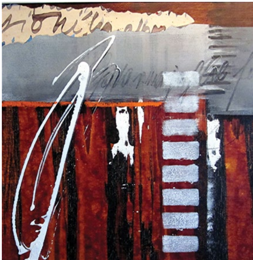
Баш сада II комб. техника 52 x 52 cm