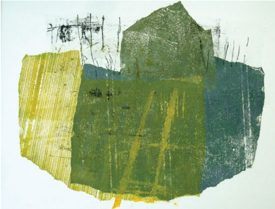
Чизма I литографија 50 x 65 cm