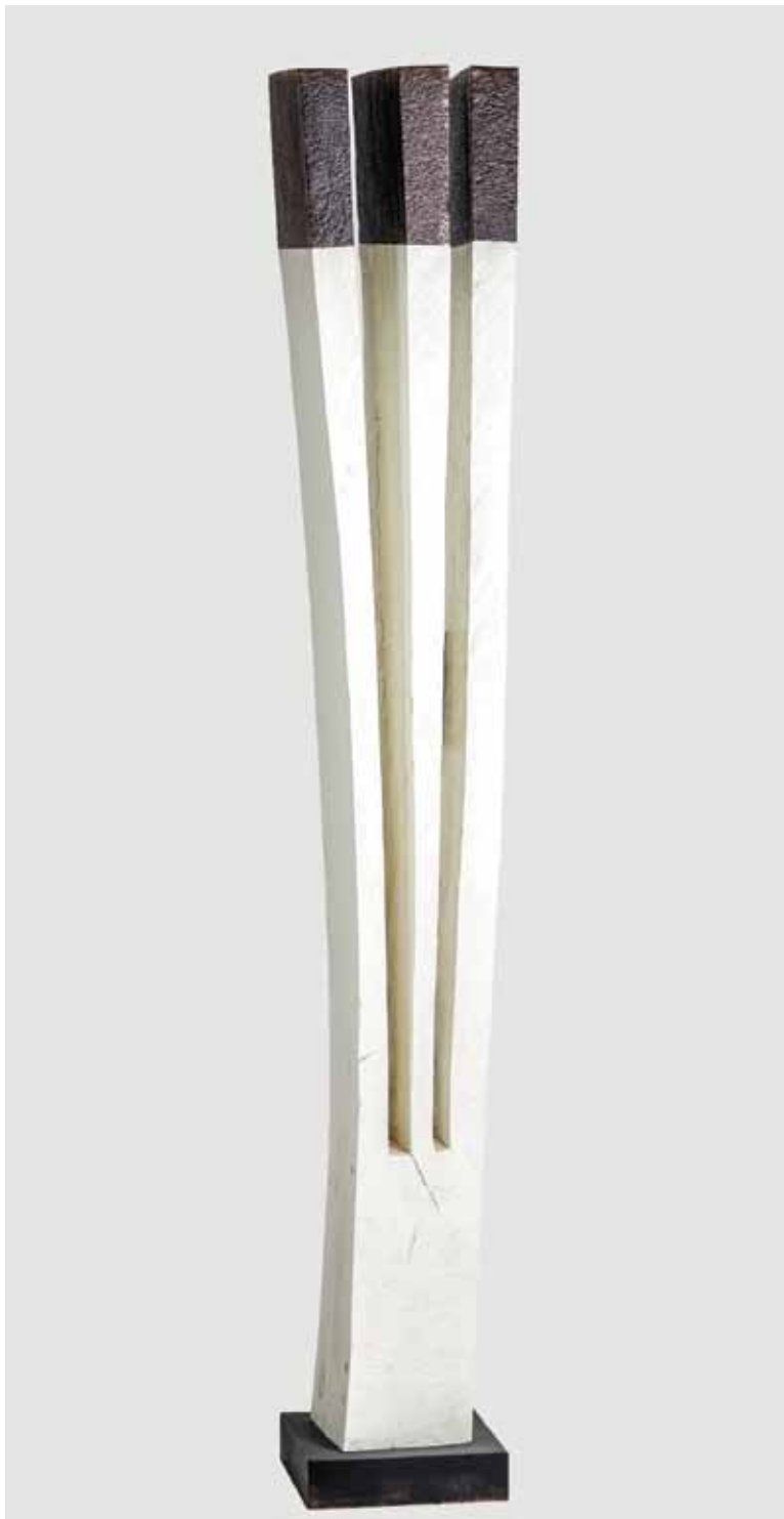
Бела пропулзија / White Propulsion дрво, метал / wood, metal h 250 cm