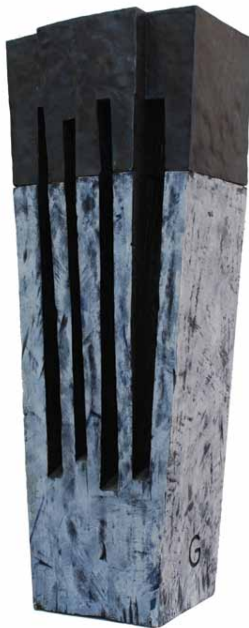
Мала бела пропулзија / Little White Propulsion дрво, метал / wood, metal h 100 cm