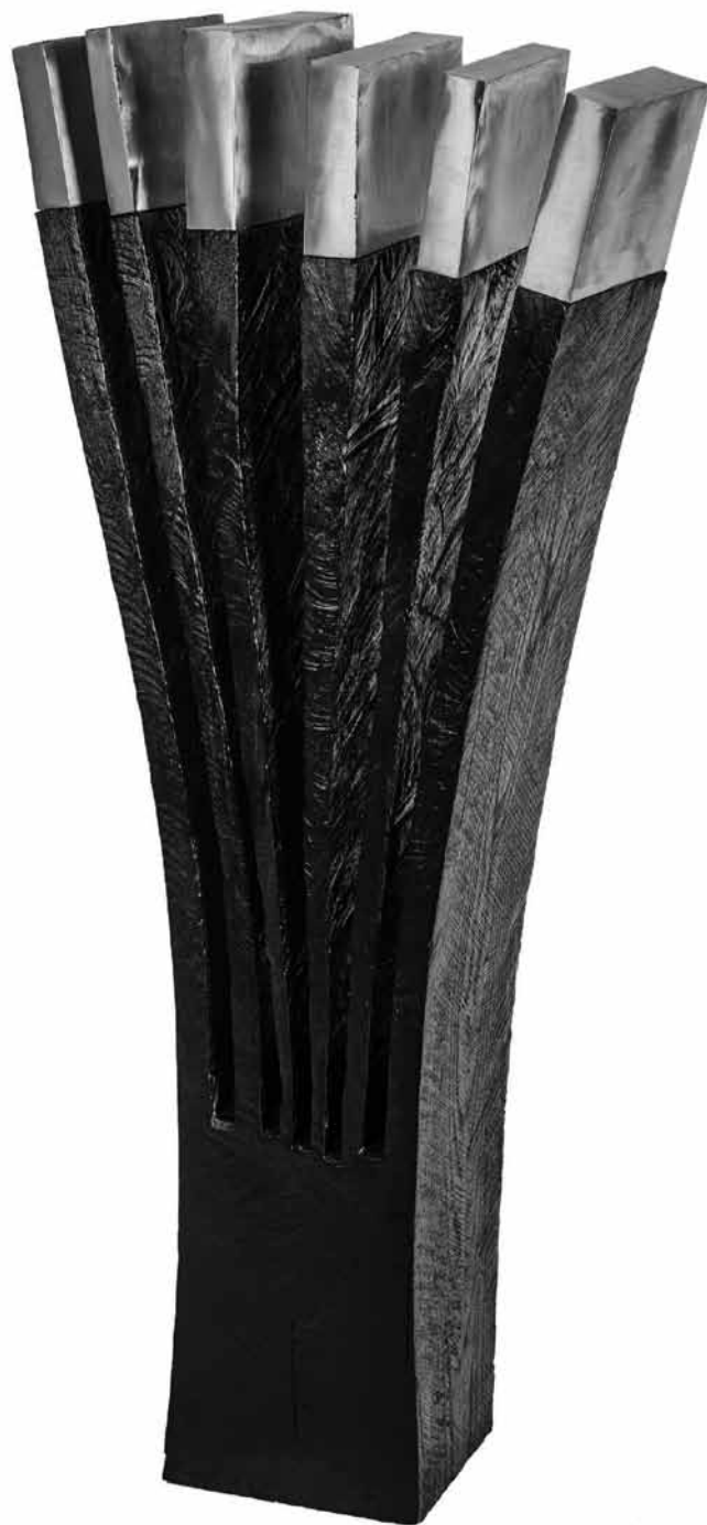
Зрак / Ray дрво, инокс / wood, inox h 110 cm