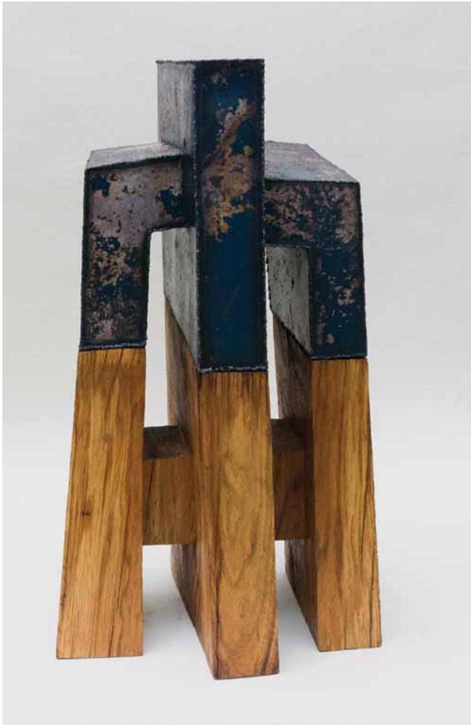
Плава / Blue дрво, метал / wood, metal h 80 cm