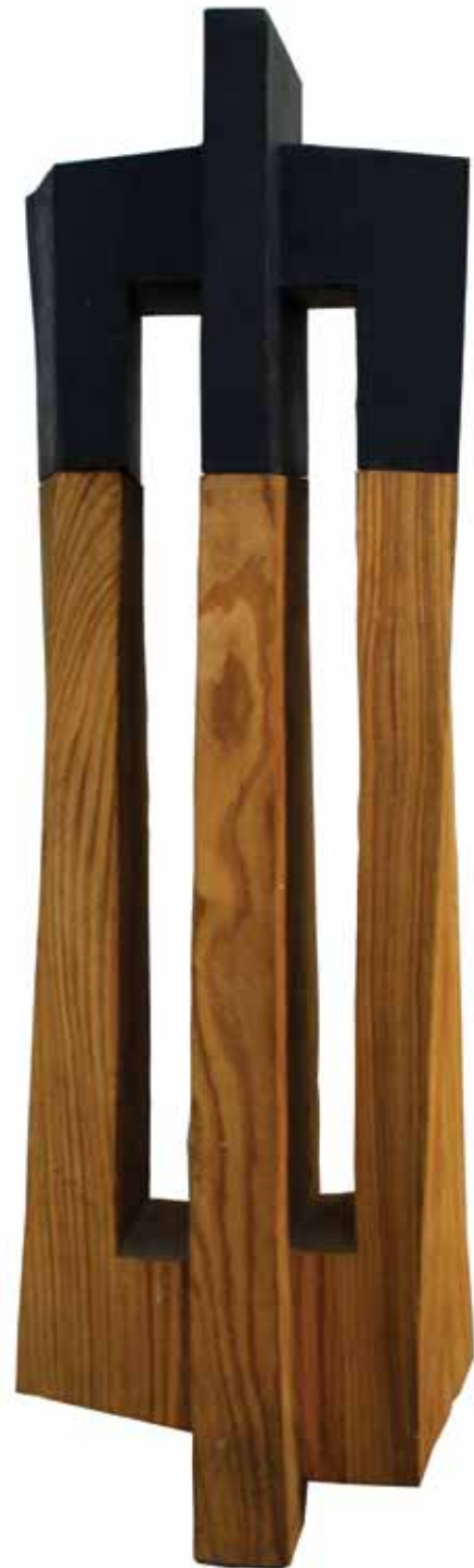
Ф пропулзија / F Propulsion дрво, метал / wood, metal h 160 cm