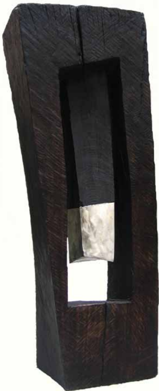
Композиција / Composition дрво, инокс / wood, inox h 130 cm