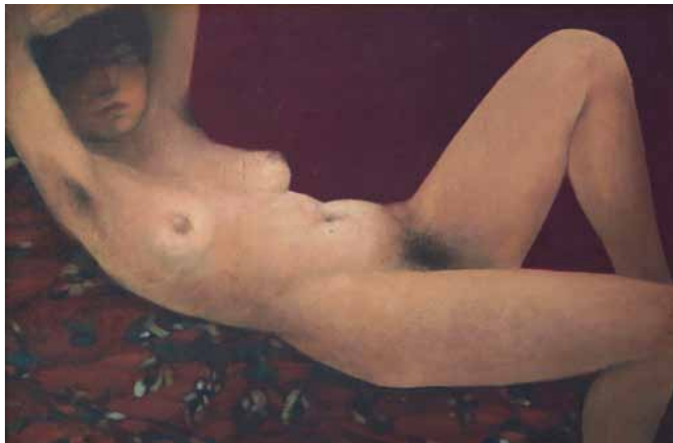
Драгана Јовчић Акт, 1978. уље на платну, 27 x 40 cm