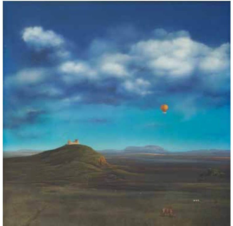
Владимир Пајевић Пад великог балона, 1986. уље на платну, 65 x 65 cm