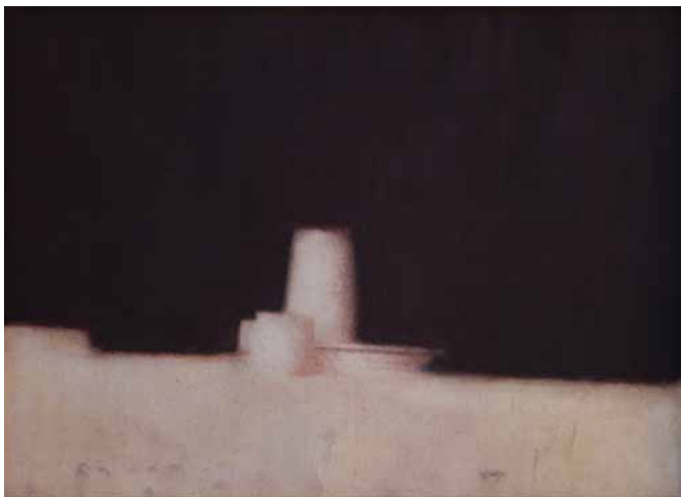
Драгослав Живковић Мртва природа, 1986. гваш, 21 x 29 cm