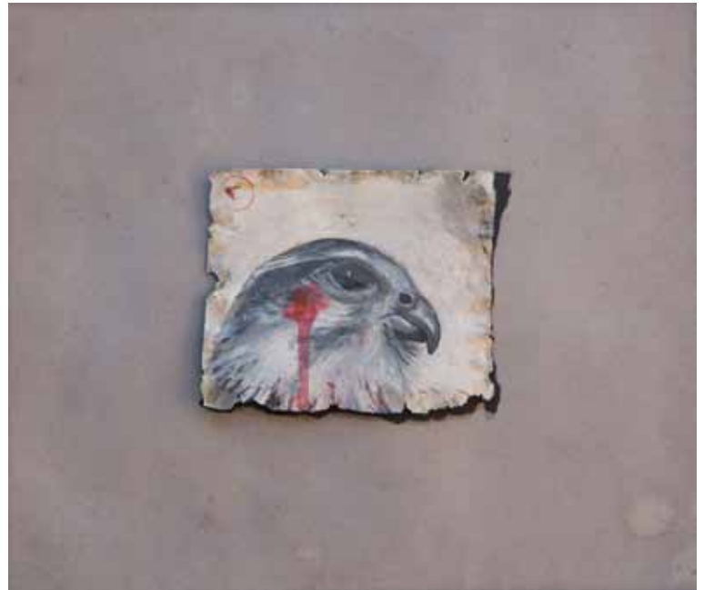
Ана Капор Око соколово , 1990. комб. тех. на картону, 23 x 27 cm