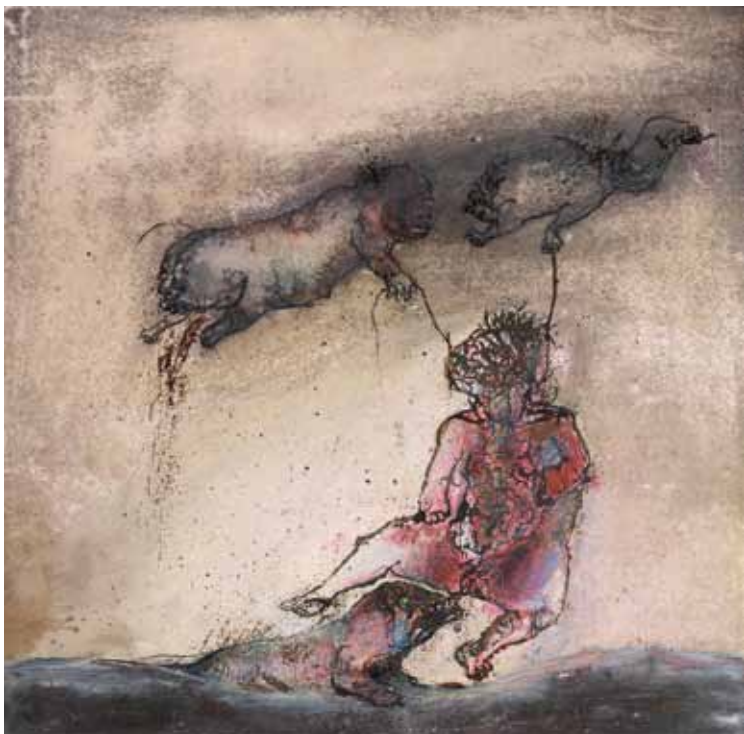
Тафил Мусовић Без назива 2 , 1978. комб. тех. на картону, 35 x 37 cm