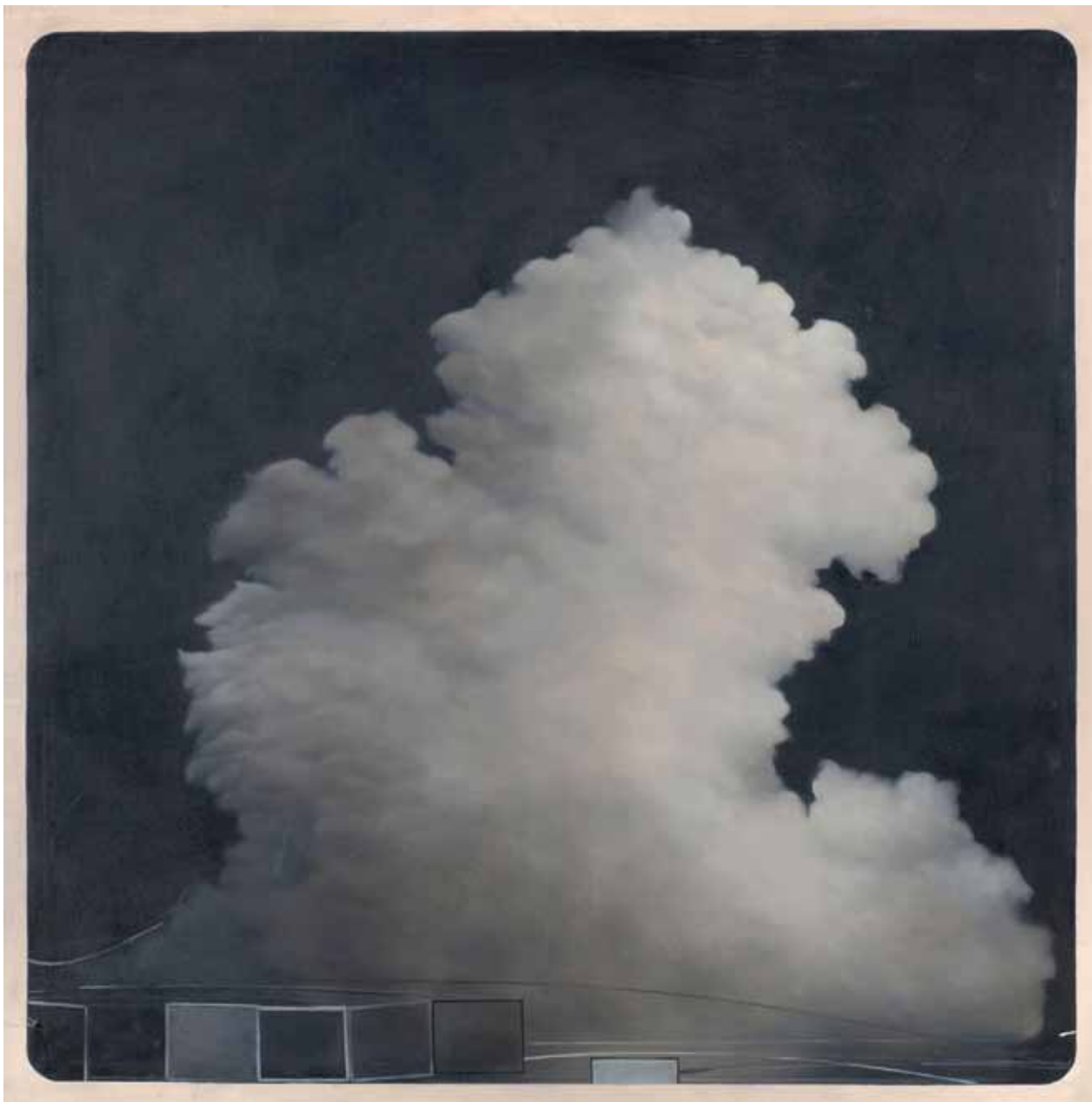
Александар Цветковић Стварање облака, 1973. уље на платну, 125 x 125 cm