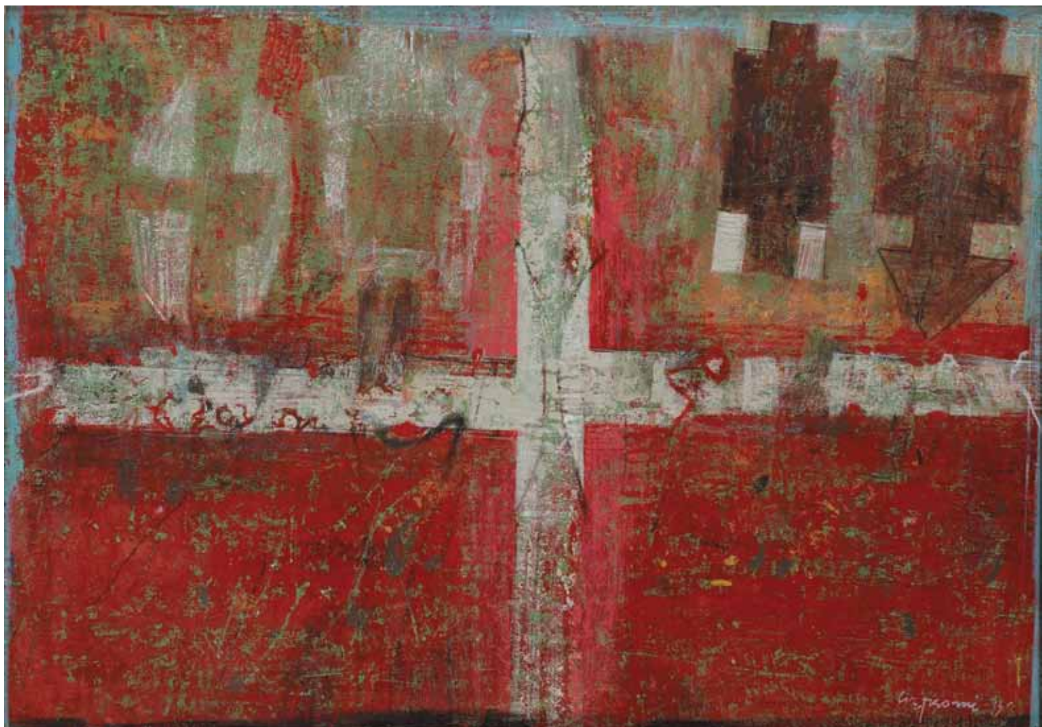
Александар Цветковић Заставе , 1993. уље на платну, 45 x 65 cm