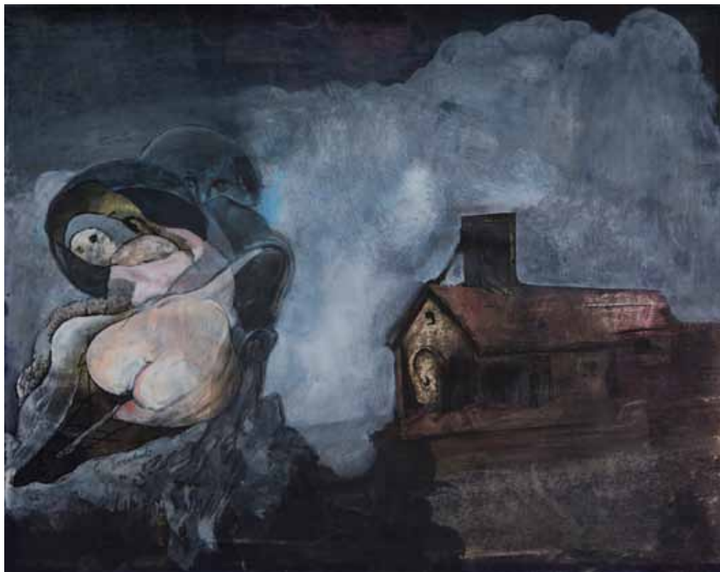
Станко Зечевић Акт, 1987. комб. тех. на картону, 33 x 41 cm