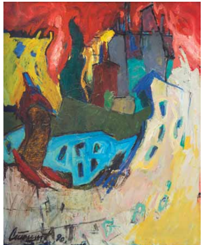
Томислав Стошић Кућа , 1990. уље на платну 85 x 60 cm