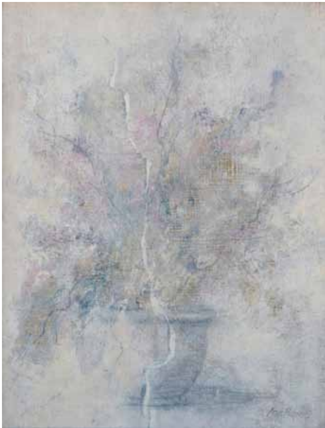
Ана Капор Помпеја , 1990. уље на платну, 24 x 19 cm