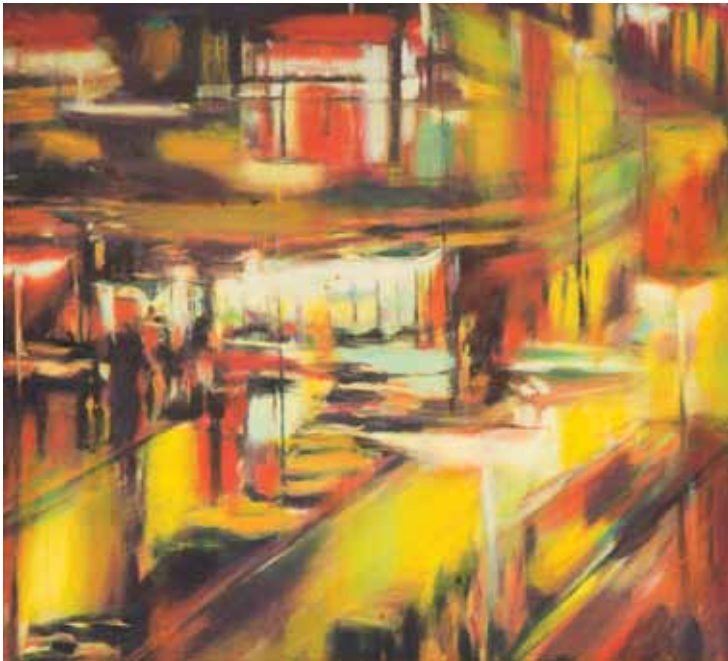
Небојша Здравковић Вечерња киша , 1985. уље на платну, 50 x 65 cm