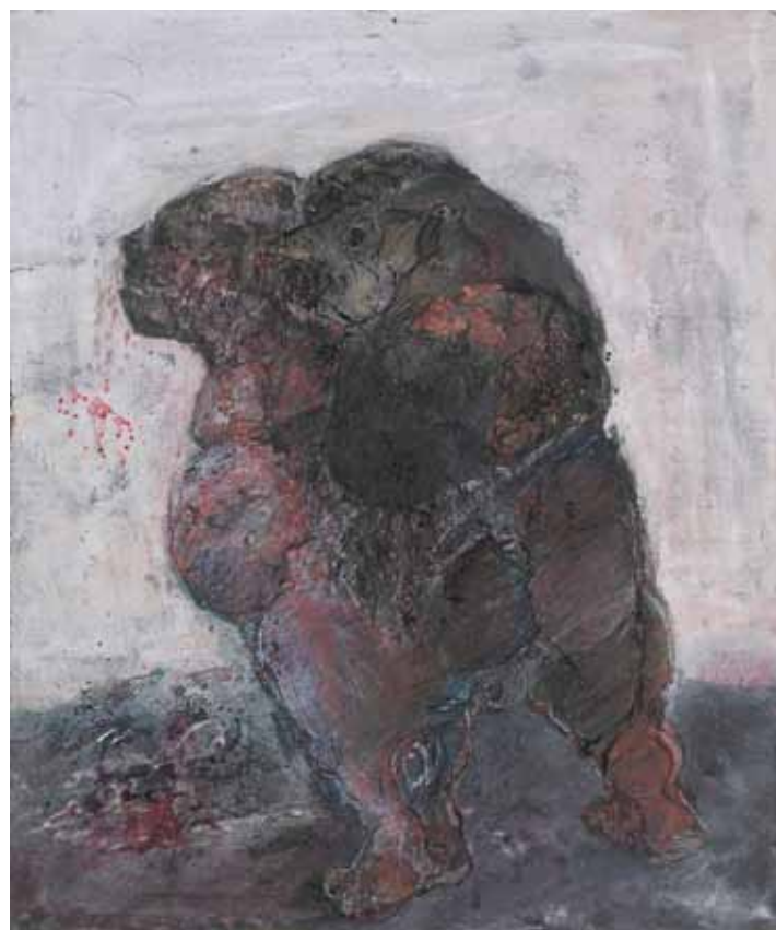
Тафил Мусовић Без назива 1 , 1978. комб. тех. на картону, 35 x 29 cm