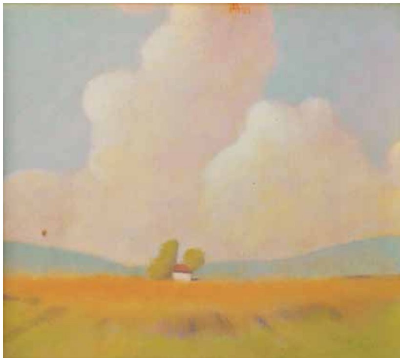
Драгослав Живковић Пејсаж, 1989. уље на платну, 25 x 23 cm