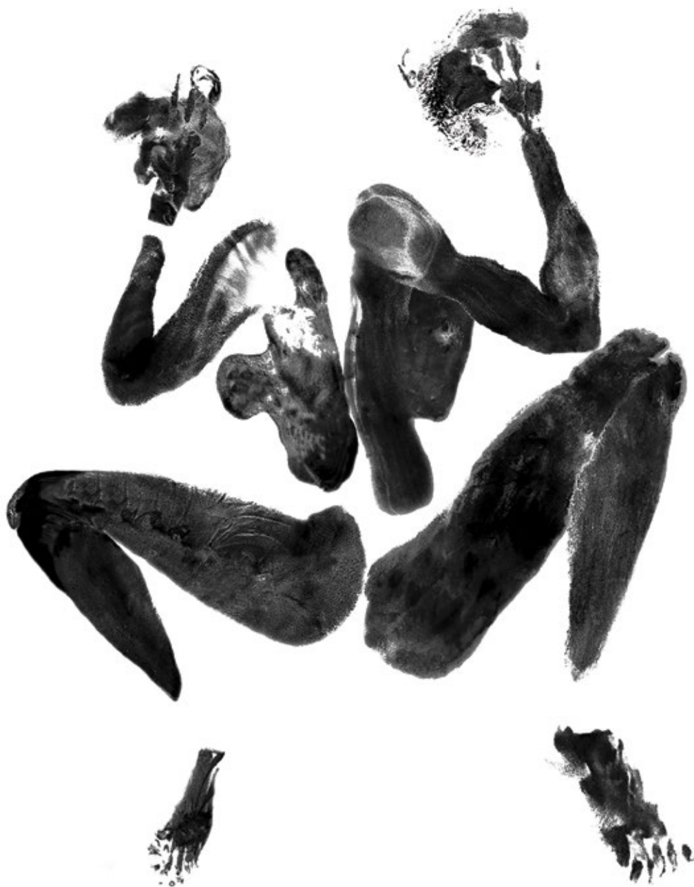
Кревет 4 2002, дигитална графика 2 x 63 cm x 100 cm