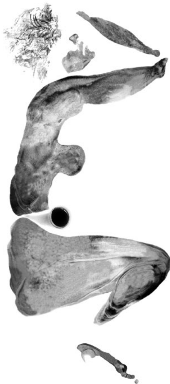
Редовно се купала 3 2002, дигитална графика 63 cm x 100 cm