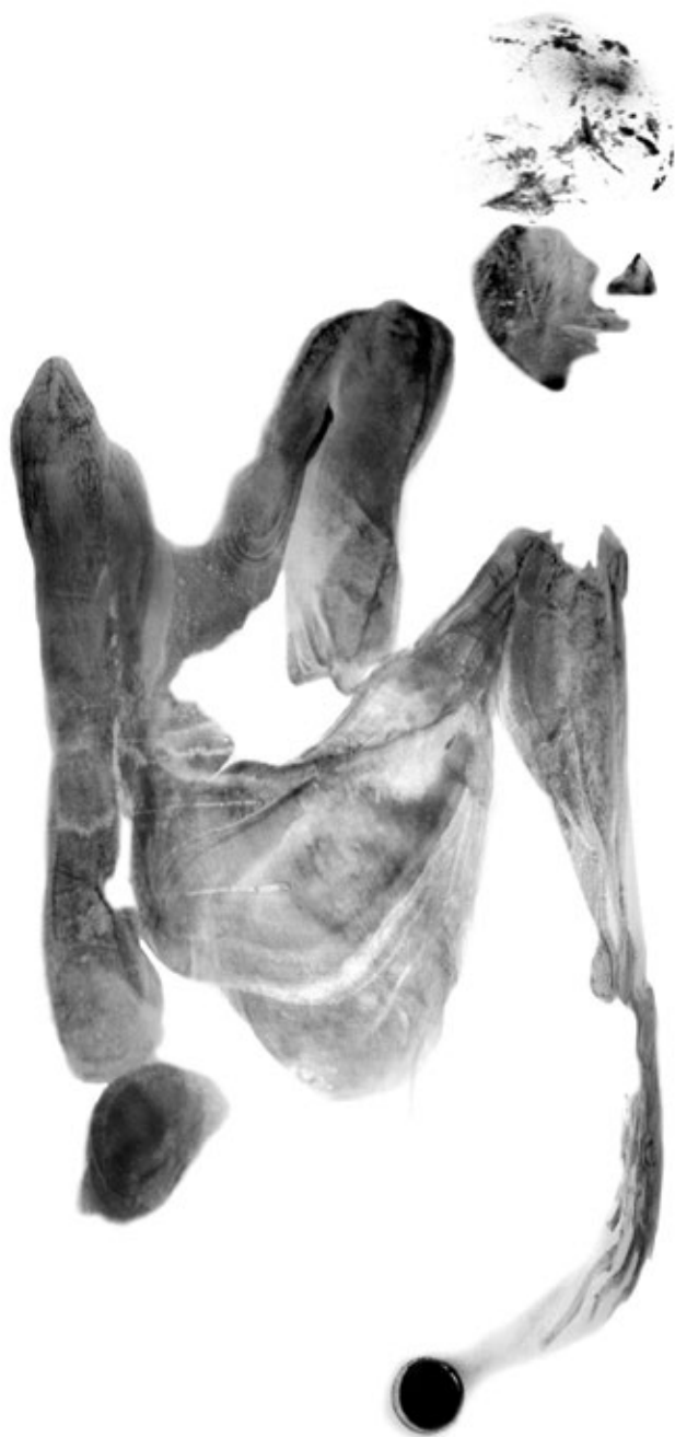
Редовно се купала 1 | She Bathed Regularly 1 2002, дигитална графика | 2002, digital print 63 cm x 100 cm | 63 cm x 100 cm