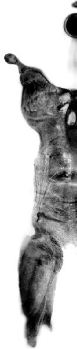
Редовно се купала 2 2002, дигитална графика 63 cm x 100 cm