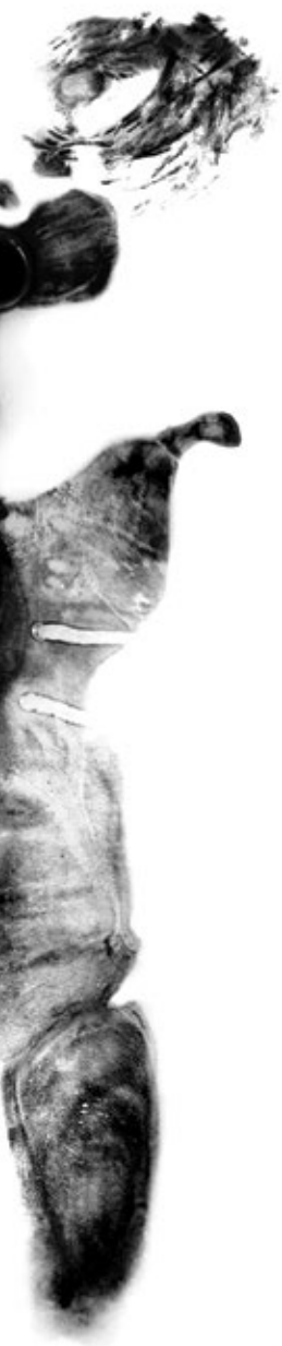
She Bathed Regularly 2 2002, digital print 63 cm x 100 cm