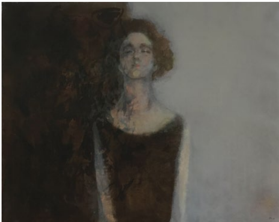
Бдење 1 2016, уље на платну 80 x 100 x 4 cm