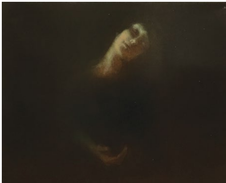
Бдење 4 2016, уље на платну 80 x 100 x 4 cm