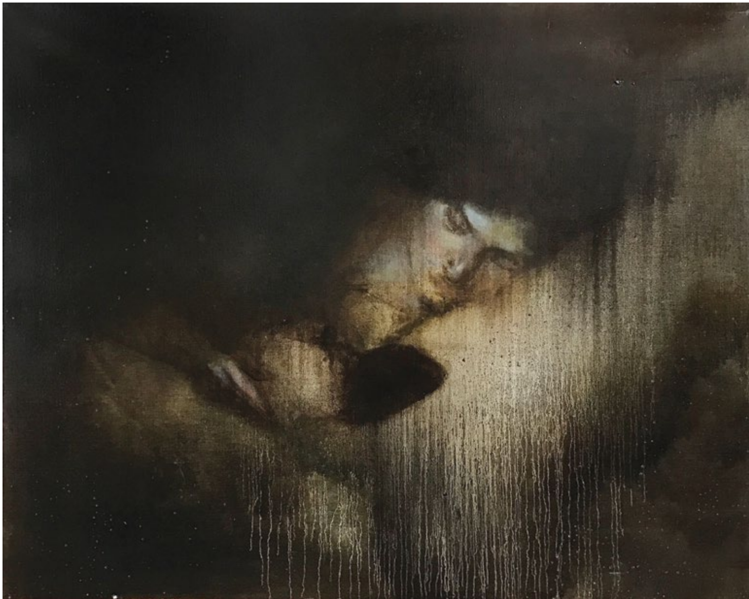
Бдење 2 Vigil 2 2016, уље на платну 2016, oil on canvas 80 x 100 x 4 cm 80 x 100 x 4 cm