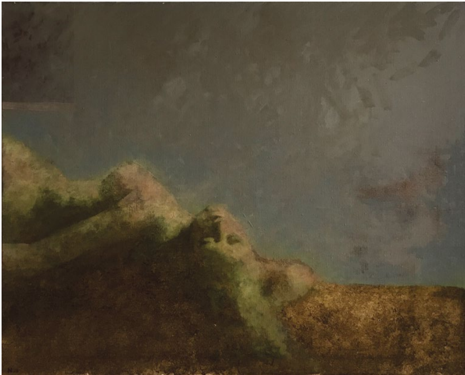
Бдење 10 | Vigil 10 2016, уље на платну | 2016, oil on canvas 80 x 100 x 4 cm | 80 x 100 x 4 cm