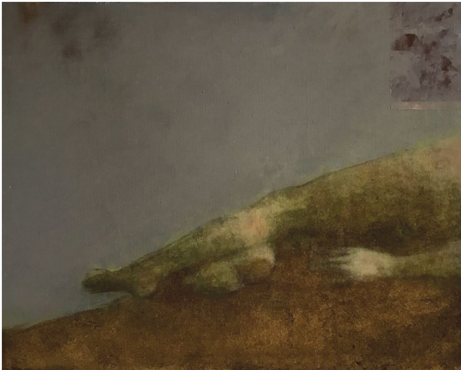
Бдење 9 Vigil 9 2016, уље на платну 2016, oil on canvas 80 x 100 x 4 cm 80 x 100 x 4 cm