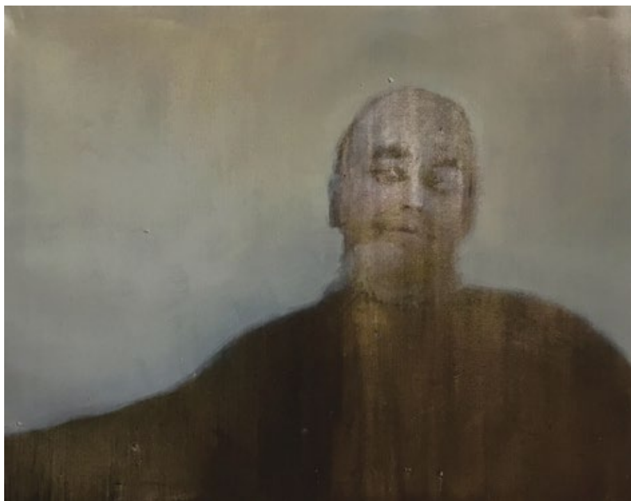
Бдење 5 2016, уље на платну 80 x 100 x 4 cm