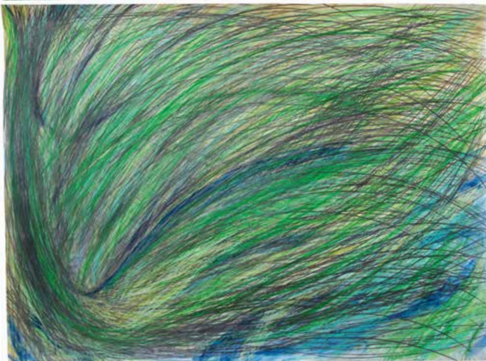
Medusa Tribuna 2015, 140x100cm, графит, пастел на папиру Medusa Tribuna 2015, 140x100, graphite, pastel on paper