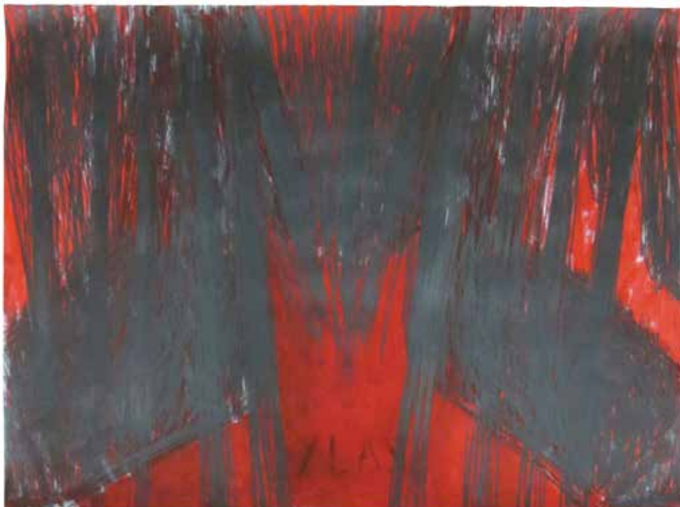
Улаз 2015, 140x100cm, графит, акрилик на папиру Entrance 2015, 140x100cm, graphite, acrylic on paper