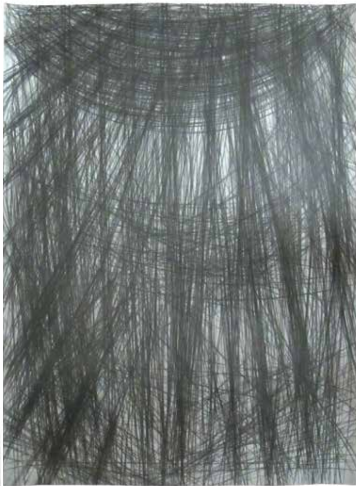
Ходник 2015, 100x140cm, графит на папиру Corridor 2015, 100x140cm, graphite on paper