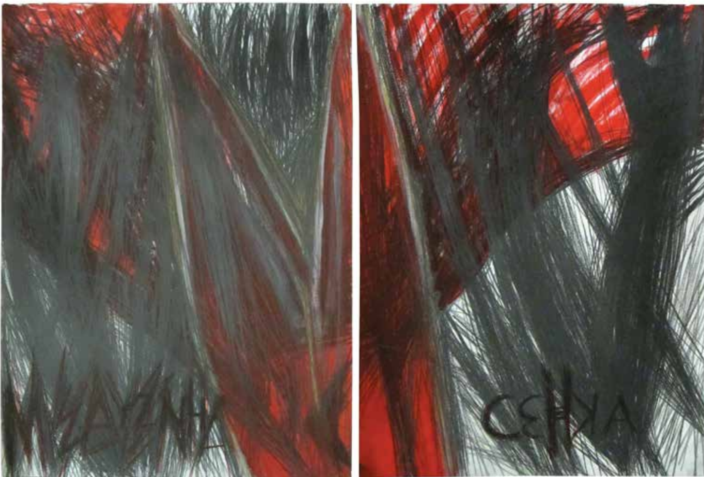
Медузина сенка 2015, 100x140cm, графит, акрилик на папиру Medusa's Shadow 2015, 100x140cm, graphite, acrylic on paper