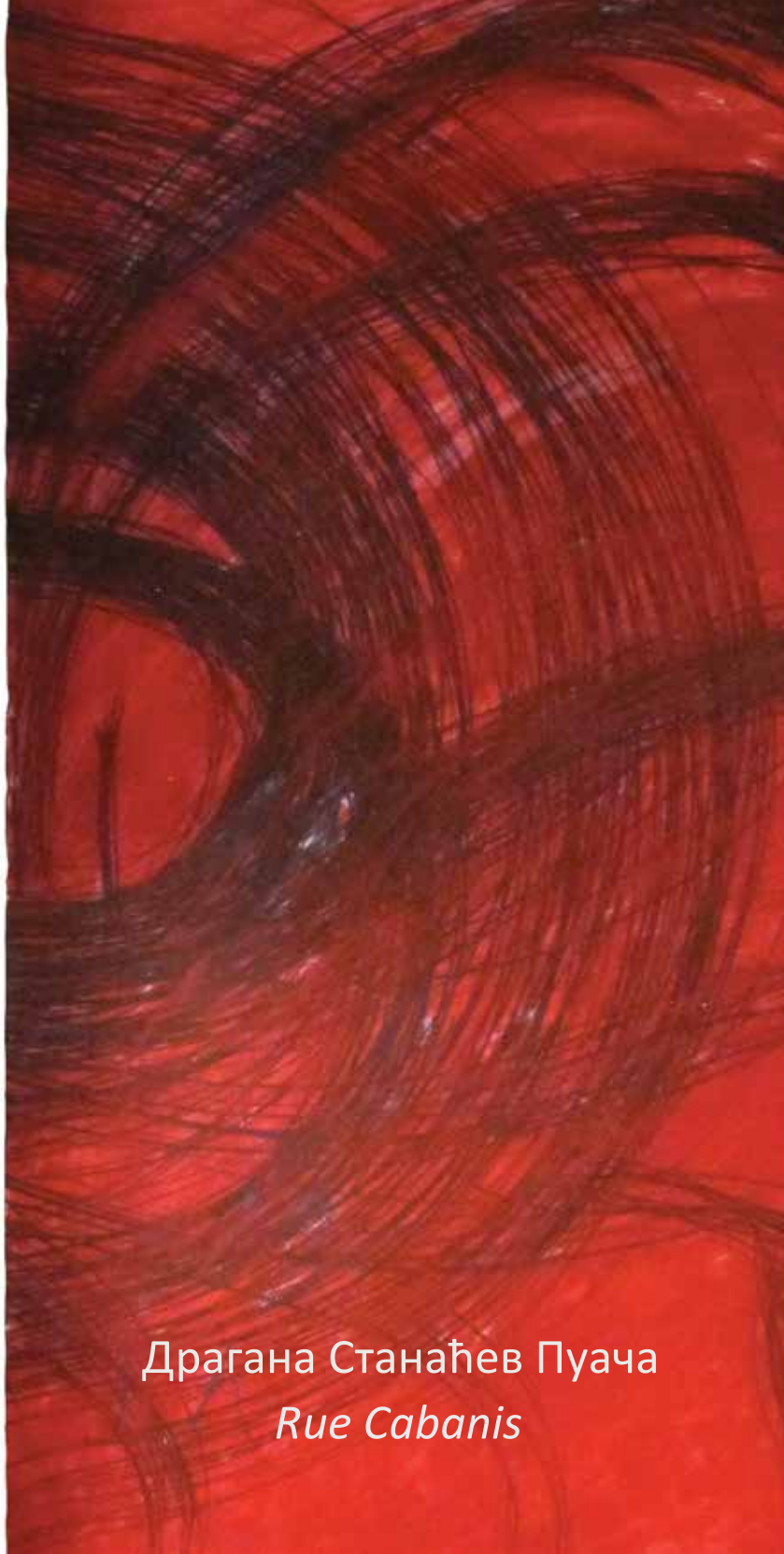
Драгана Станаћев Пуача Rue Cabanis