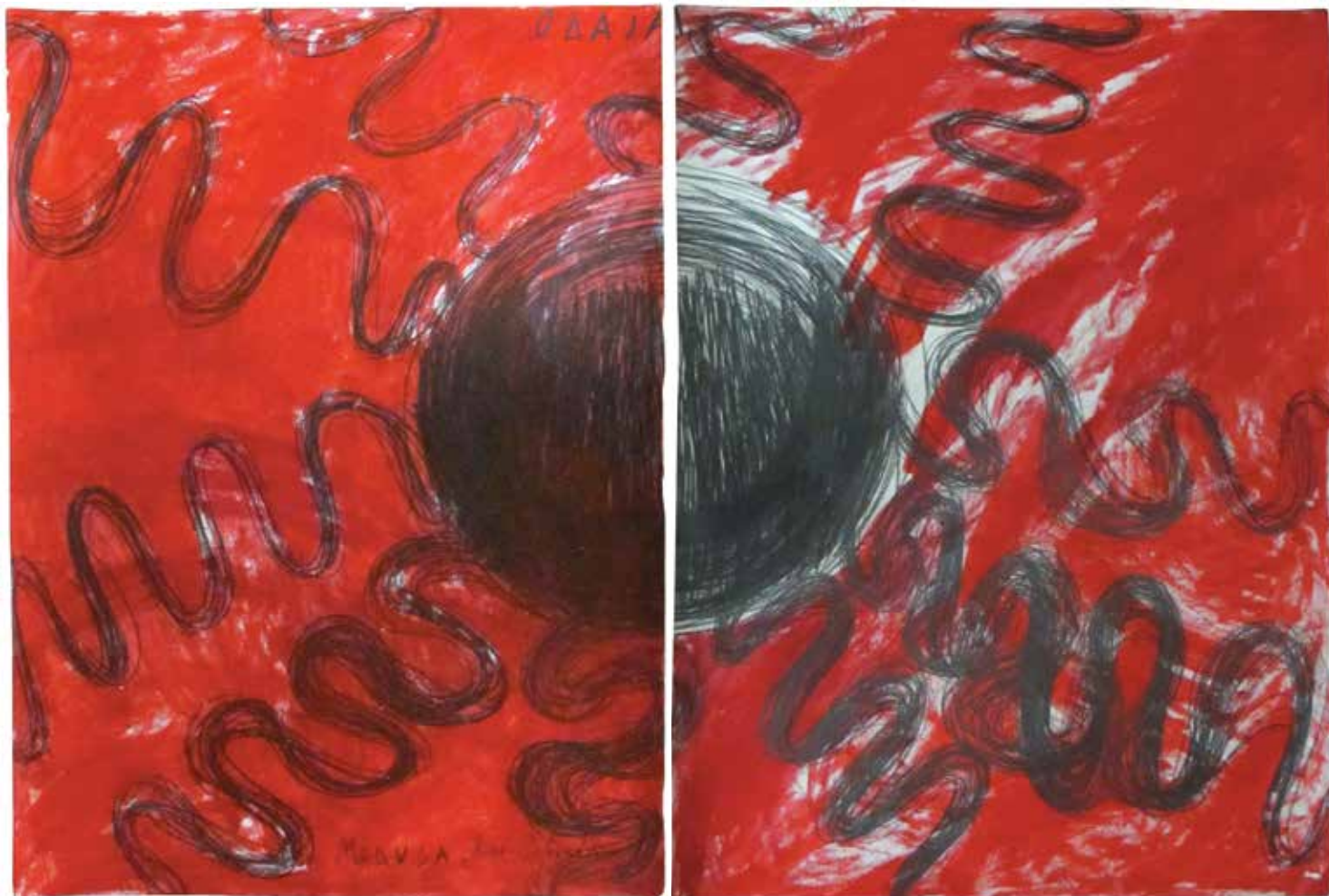
Odaja 2015, 100x140cm, графит, акрилик на папиру Chamber 2015, 100x140cm, graphite, acrylic on paper