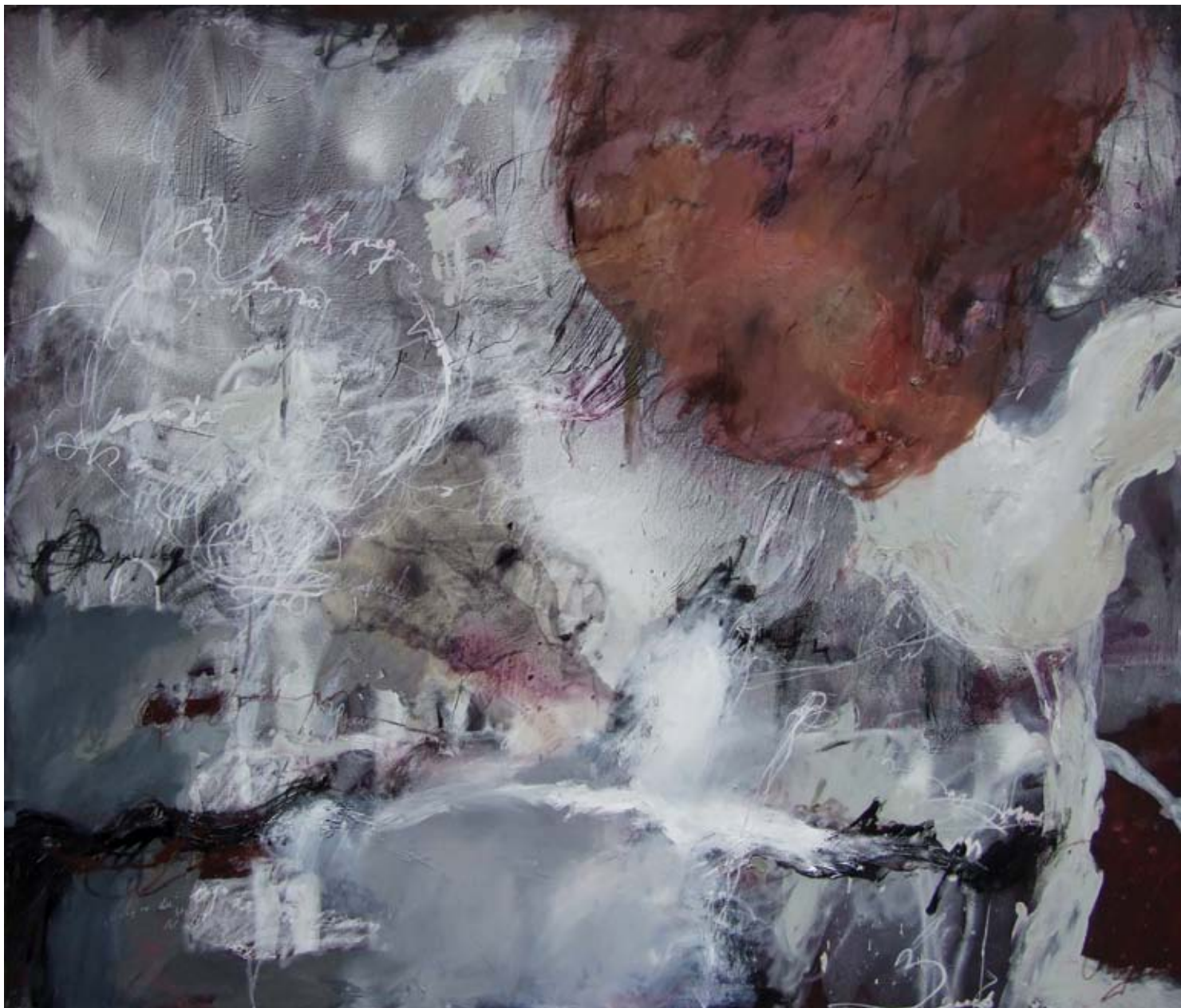
Шапутађе, комб. техника, акрилик и уље на платну, 155 x 175 cm

Whispering, mixed media, acrylic and oil on canvas, 155 x 175 cm