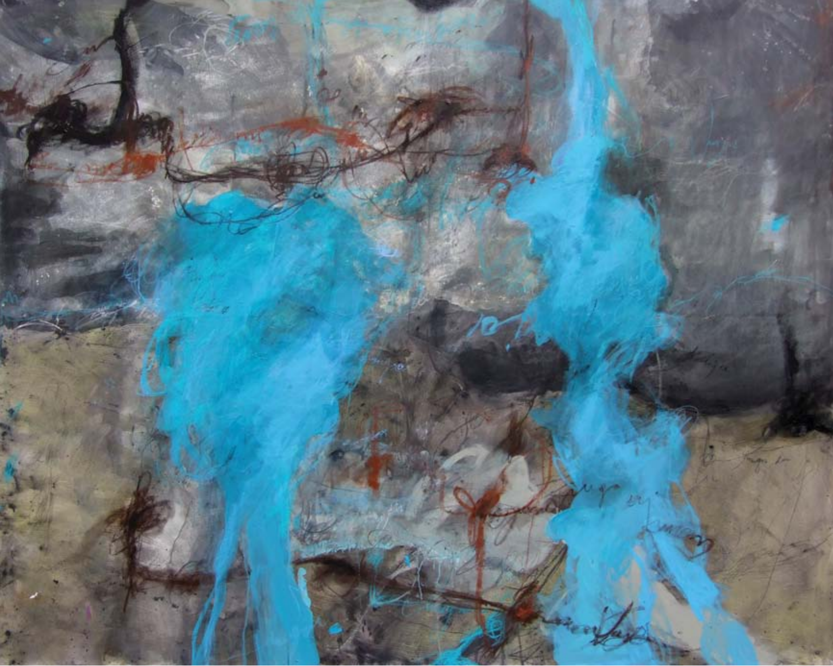
ЈЕЛЕНА ТУРИЋ / САЊАРИ