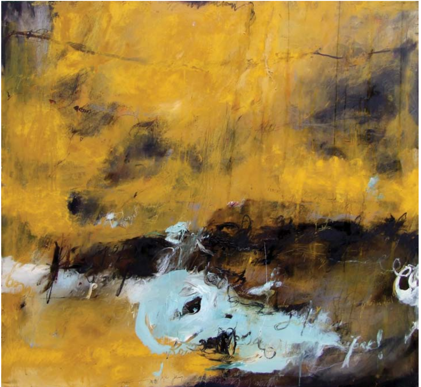
Треперење , комб. техника, акрилик и уље на платну, 160 x 180 cm Twinkling , mixed media, acrylic and oil on canvas, 160 x 180 cm