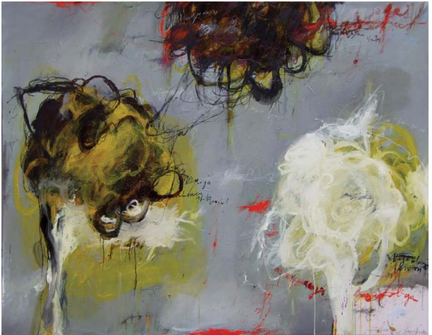
Баскање, комб. техника, акрилик и уље на платну, 155 x 175 cm Chatting , mixed media, acrylic and oil on canvas, 155 x 175 cm