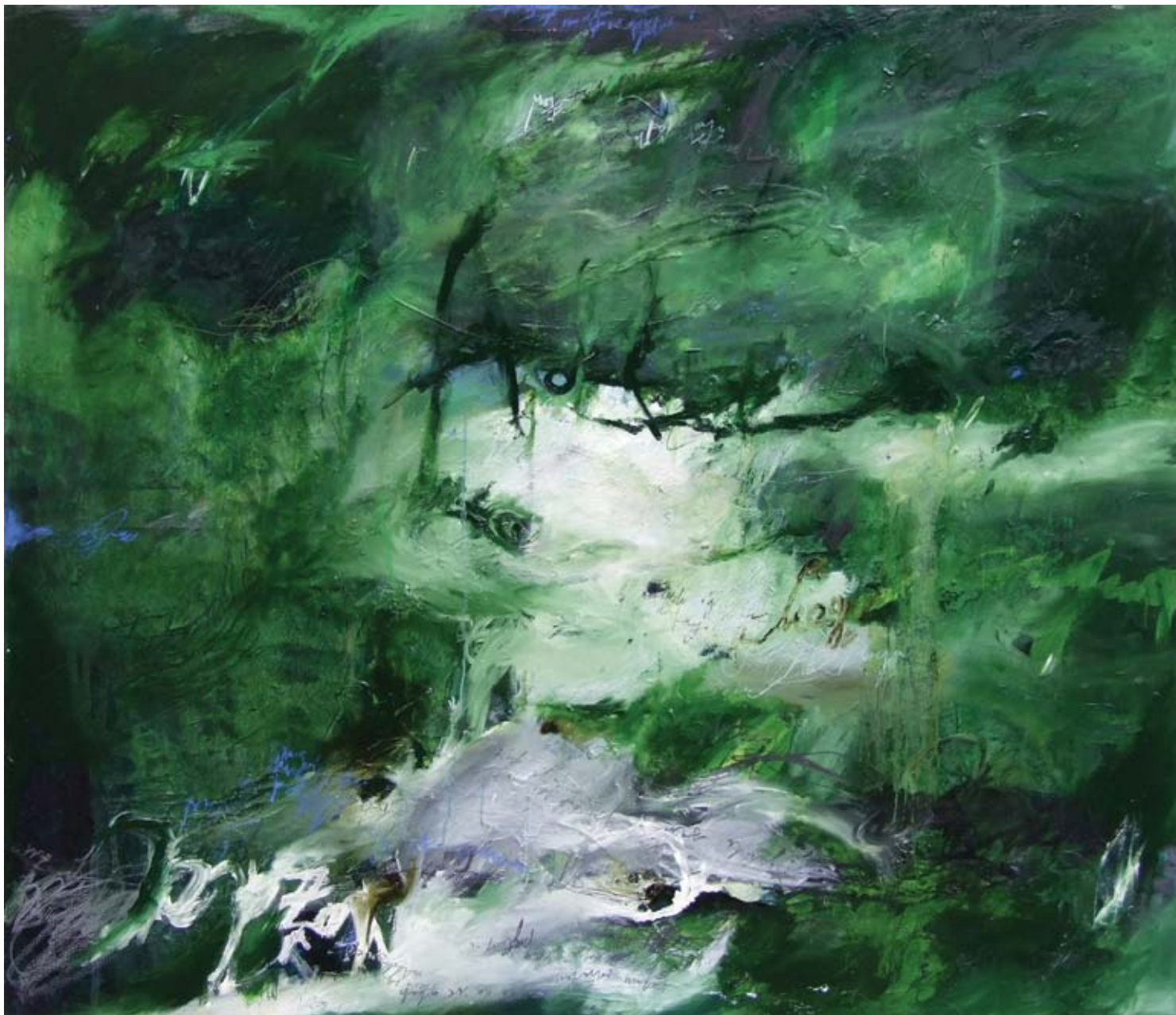
Разведравање , комб. техника, акрилик и уље на платну, 155 x 175 cm