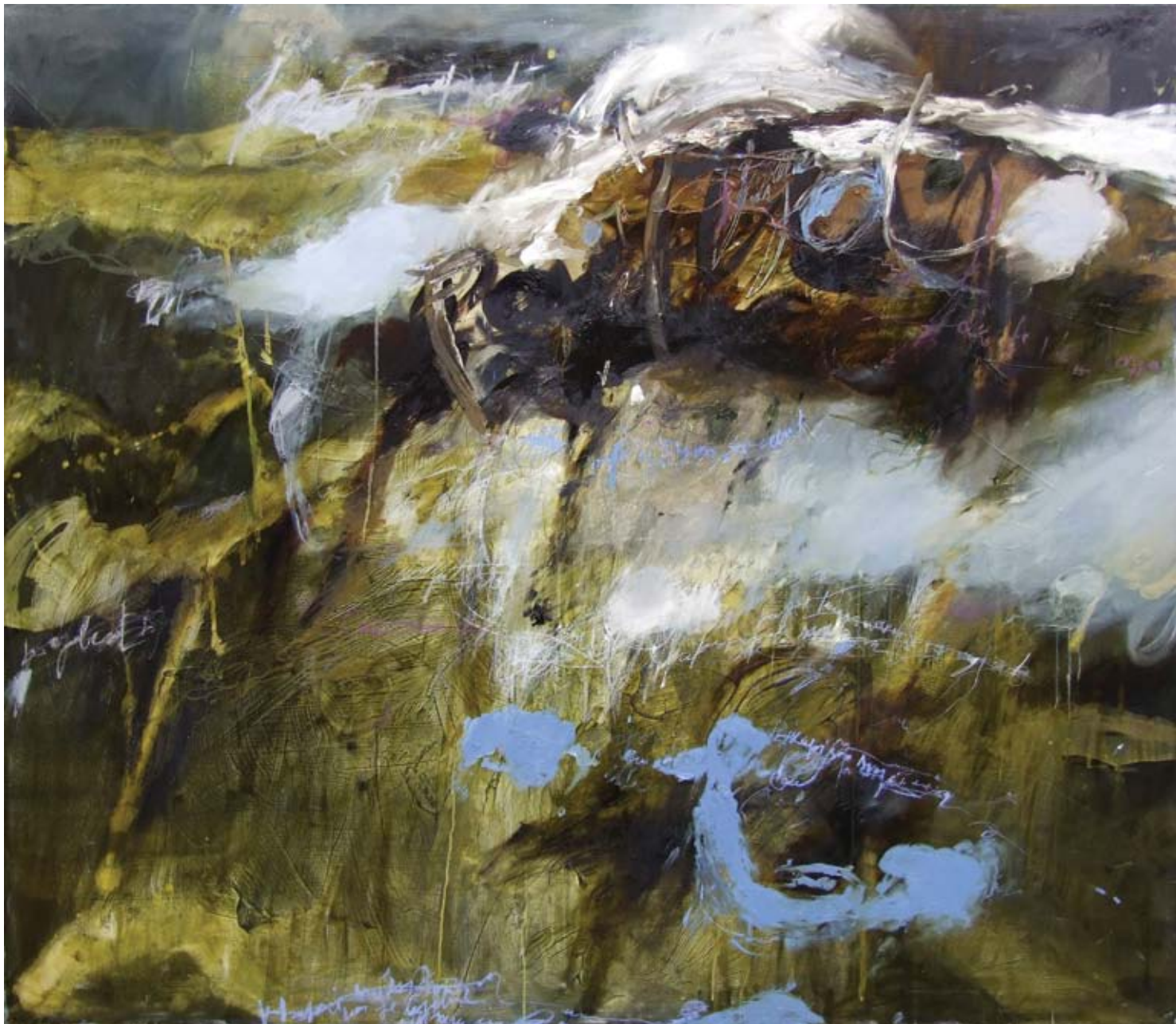
Моје место , комб. техника, акрилик и уље на платну, 155 x 175 cm