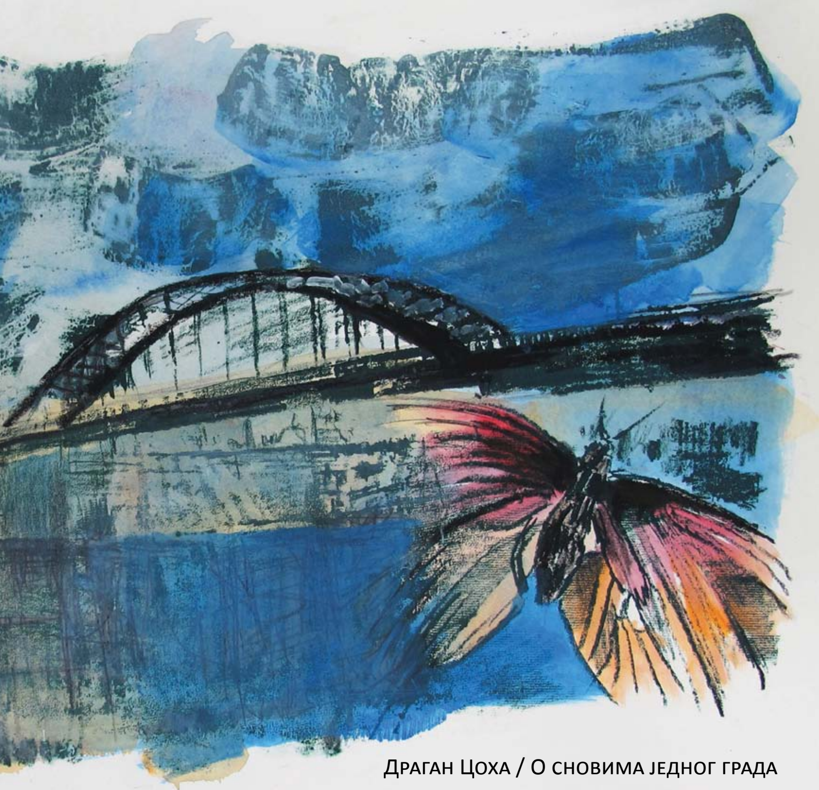
ДРАГАН ЦОХА / О СНОВИМА ЈЕДНОГ ГРАДА